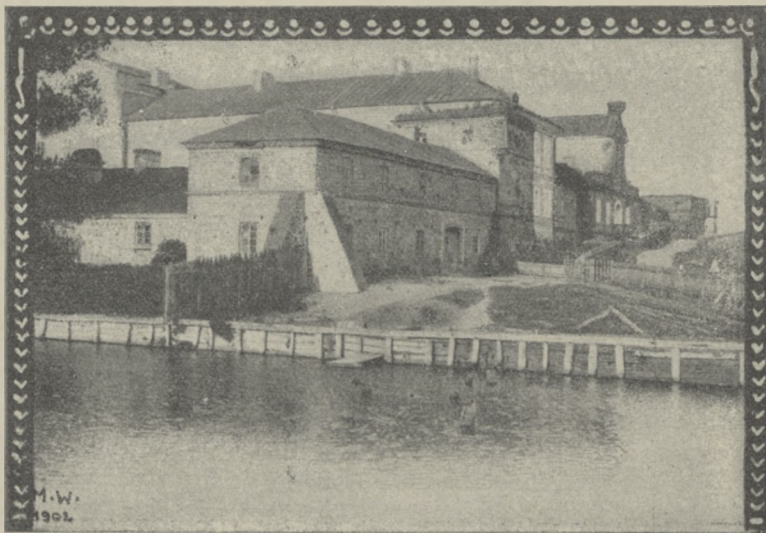
ZAMEK W JANOWIE

sztukę ludu. Nawet barwisty Tetmajer jest tylko śmiałym realistycznym odtwórcą scen lu- dowych; Krasnowolski, ludowiec, malarz o wy- bitnym i upartym talencie najbardziej może zbli- żyć się ku prawdzie — ale i temu bruździ jego aka-