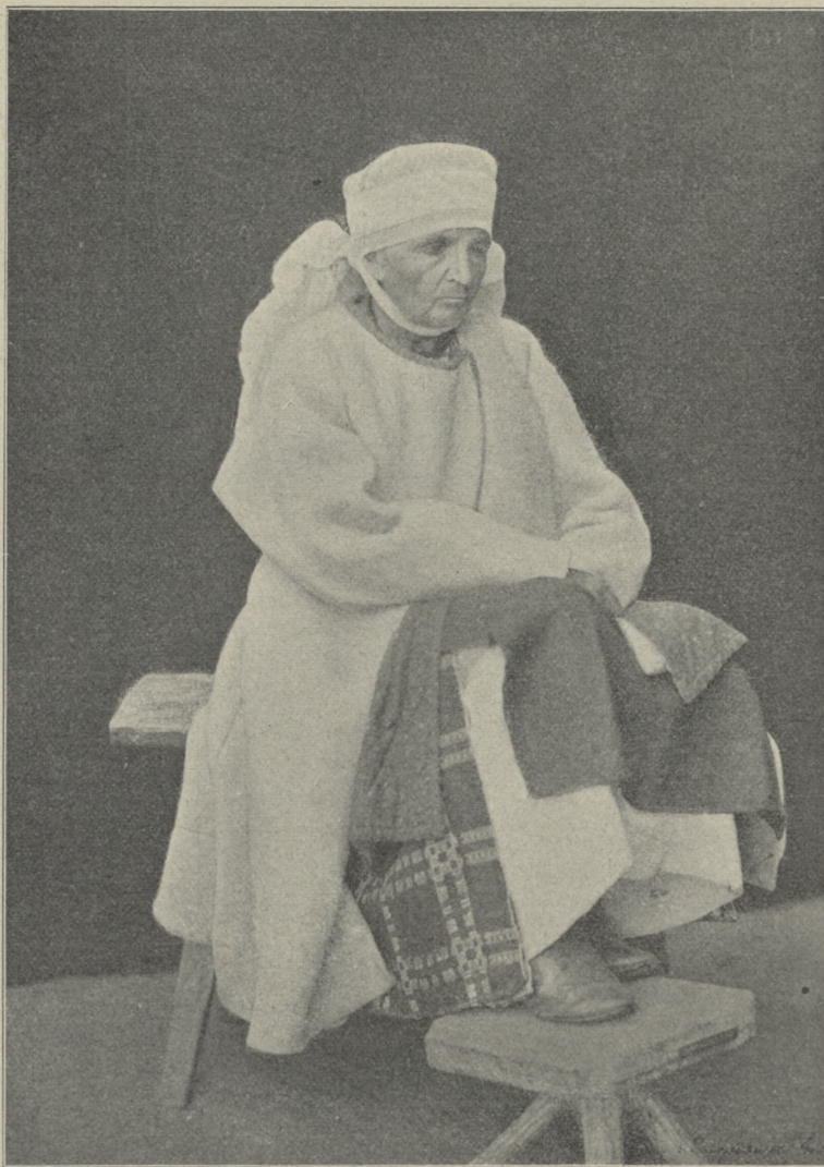
UKRAINKA W NAMITCE