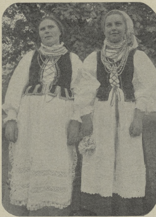
WŁOŚCIANKI Z POD GOSTYNINA

Role w polach miejskich kupił: 1 od Słupeckiego w r. 1752, 3 od Malinowskiego w r. 1759,