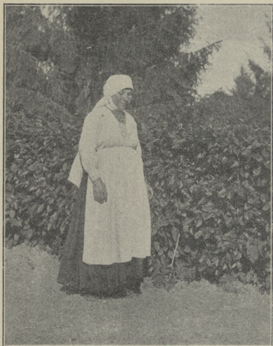
WŁOŚCIANKA Z POW. USZYCKIEGO (Podole)