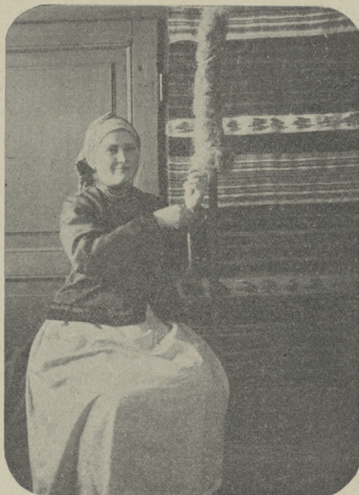
WŁOŚCIANKA Z POW. USZYCKIEGO (Podole)

pielicami (fl. 316 gr. 20), opończa amarantowa, opończa szara, pas turecki popielaty, pas srebrny stambulski, spodnie czerwone, spodnie pół-sukienne, kaftan skórzany, kaftan flanelowy, szlafrok, czapka, 2 pary butów, 2 kobierce, dywan, kołdra bagazyowa (z materyi bawełnianej) jedwabna z niebieskim brzegiem i słupem czerwonym i t. d. Wśród cyny oszacowanej na fl. 668 gr. 6 i miedzi (fl. 1736 gr. 23), znajdował się obuch (gatunek dawnej broni, mającej koniec cieńszy, od młotka idący, zakrzywiony), 2 pistolety, moździerz, żelazko do prasowania, wagi, gwichty i t. d. Płacono wówczas za korzec pszenicy fl. 20, żyta fl. 12, owsa fl. 8, grochu fl. 20, kaszy jaglanej ćwierć fl. 8. Razem, po spieniężeniu tego wszystkiego, co było do sprzedania, Zawadzki otrzymał mniej fl. 15,947 gr. 82, aniżeli powinien był wziąć podług cen, jakie Barszcz wystawił w r. 1768, przed samym zgonem. Andrzej Zawadzki, już w r. 1759 był zapisany na liście fryców, to jest chłopców kupieckich, w r. 1760 i 64, był ich marszałkiem, 1762 i 63 — sędzią. W r. 1770, zapisany do Zgromadzenia Kupców, od 1772 do 1787 zasiadał na posiedzeniach jako vice-