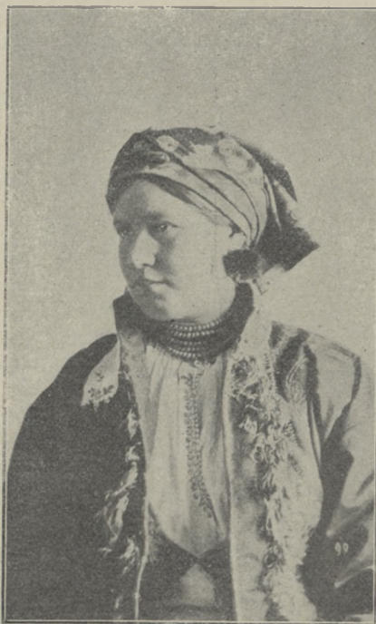
WŁOŚCIANKA Z KAZIMIERZY WIELKIEJ (w Proszowskiem)