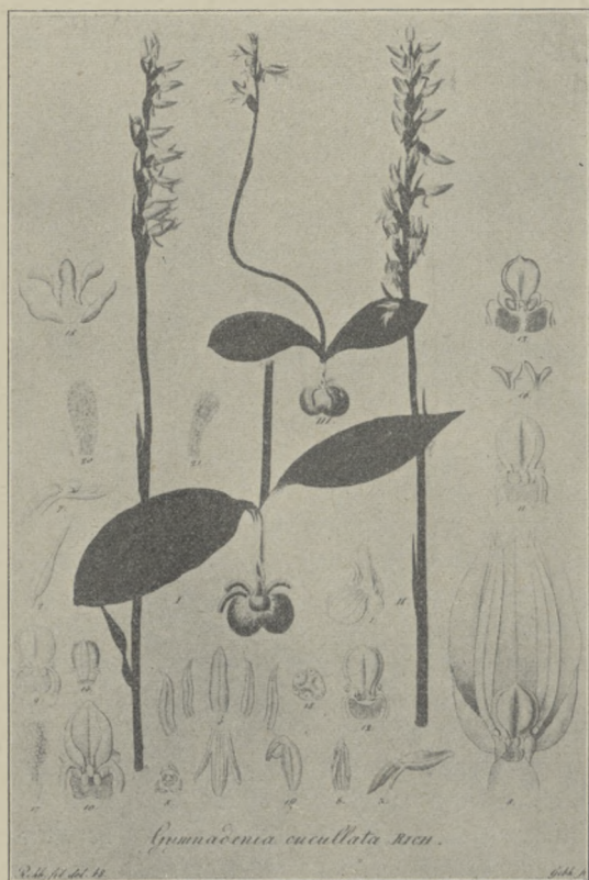
7. Gymnadenia cucullata Rich. Golek kapturkowaty.

Bulwy poprzecznie owalne, czasami tępo dwudzielne, pokryte łamliwymi brodawkami. Łodyga długa, dość wiotka. Liście dolne pochwiaste, dwa środkowe, dość duże, u podstawy obejmujące łodygę wąskie, u góry rozszerzone; górne małe i wąskie. Kwiaty dość rzadko zebrane w kłos wydłużony, zwrócone przeważnie w jedną stronę. Przykwiatki o trzech żyłkach, trochę krótsze od kwiatu. Listki kwiatu wydłużone, spiczasto stulone — tworzą zaostrowany w górę hełm. Warzka