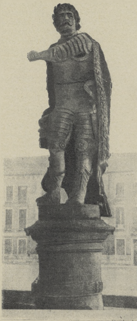
POSĄG JANA SOBIESKIEGO W PADWIE.

Tak więc kultura polska wiele zawdzięcza prastarej uczelni, słusznie więc na katedrze Galileusza wśród wieńców hołdu jubileuszowego widnieje też wieniec o białe ponsowych wstęgach z napisem: Polonia.