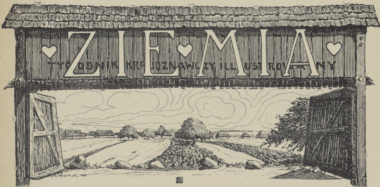
Z NASZYCH KRAJOBRAZÓW.