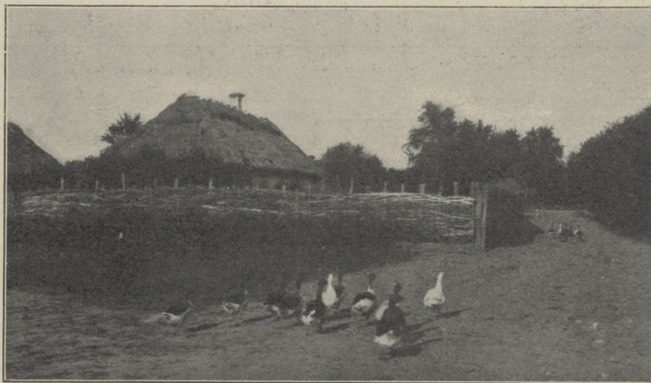
ZAGRODA PODOLSKA (pow. winnicki)

Wyborem Nałęczowa kierowały nie tylko malownicza miejscowość i tradycja dawniejszego