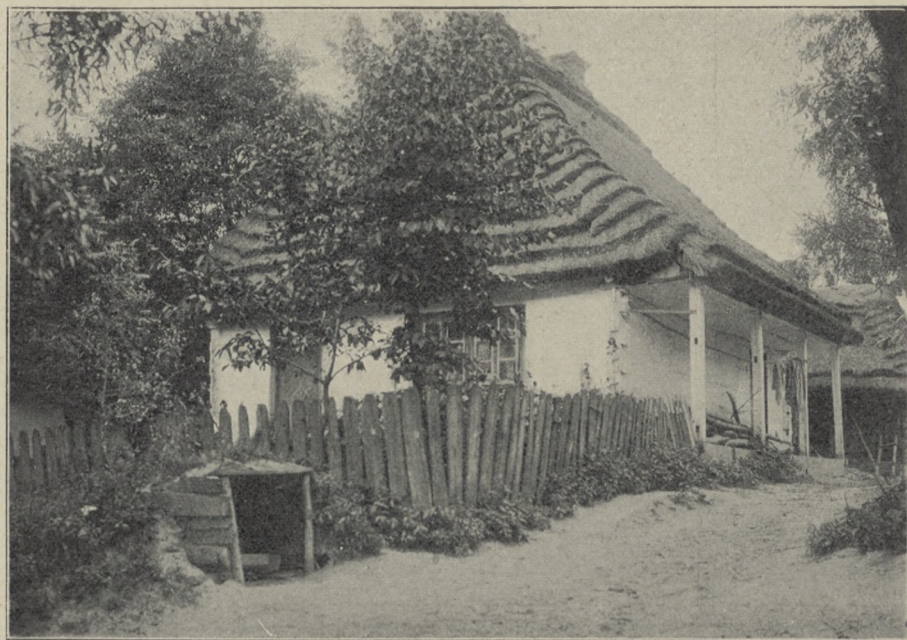
CHATA LUBELSKA (z Urzędowa, pow. janowski)

organizator tego zakładu, rozwinął niesłychaną energię: odbudował łazienki, hydropatyę i domy mieszkalne, — na pałacu wznosił drugie piętro i wieżę ciśnień, wznosił kilka pomniejszych nowych budynków gospodarskich, oczyścił staw, przeprowadził wodociąg. W roku następnym stanęły: