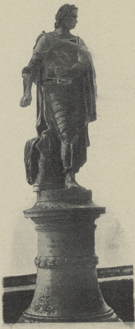
POSĄG STEFANA BATOREGO W PADWIE.

swą zawartość, a liczne parowce, greckie, dalmackie, tureckie, stwierdzają dawne tradycje weneckiego handlu na Lewancie.