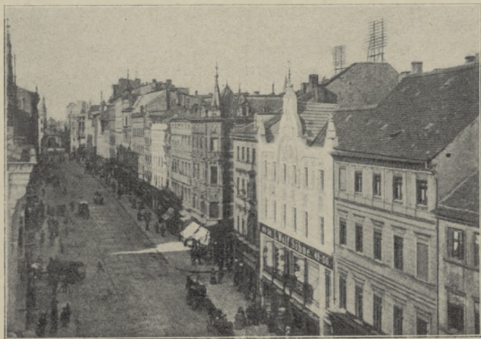
ULICA SZEROKA W SZCZECINIE.