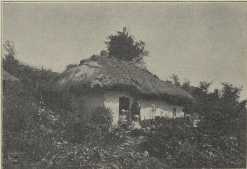
CHATA UKRAIŃSKA (pow. rzyszczowski)