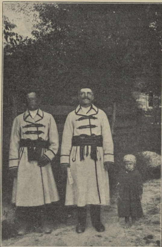
fol. St. Lencewicz. TYPY WŁOŚCIANSKIE ZE SMARDZEWIC.

Charakterystyczny dla Smardzewic typ, na który składa się w pierwszym rzędzie dopiero co opisany kształt nosa i jasne, najczęściej w zielonych odcieniach oczy, a następnie jednorodność niektórych wymiarów czaszki, zasiadł w samym środku wsi, w jedną i drugą jej stronę; bliżej końców charakterystyczne te cechy występują mniej intensywnie i rzadziej. Smardzewice ciągną się w kierunku zachodnio-wschodnim, prostopadle do Pilicy, środek wsi zamieszkuje ludność tubylcza, późniejsi zaś przybysze osiedlali się i osiedlają na jej krańcach. Nic więc dziwnego, że spostrzegamy tam nieco elementu odmiennego, wnoszonego najczęściej drogą małżeństw z kobietami wsi sąsiednich. Tak np. wśród mieszkańców zachodniego krańca Smardzewic więcej jest błękitnych oczu i jasnoblond włosów, co będzie zrozumiałe, gdy nadmienię, że o dwie wiorsty na zachód