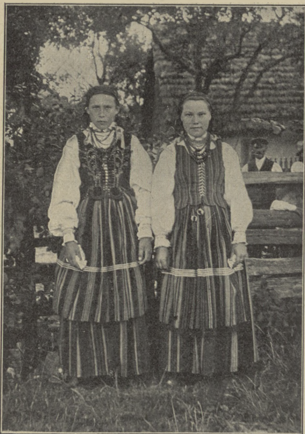
TYPY WŁOŚCIANSKIE ZE SMARDZEWIC.