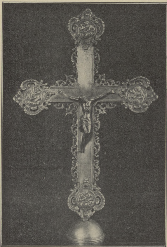
KRZYŻ SREBRNY PROCESYJNY Z KOŃCY XVII W. W KOŚCIELE SW. PIOTRA I PAWŁA W WILNIE.