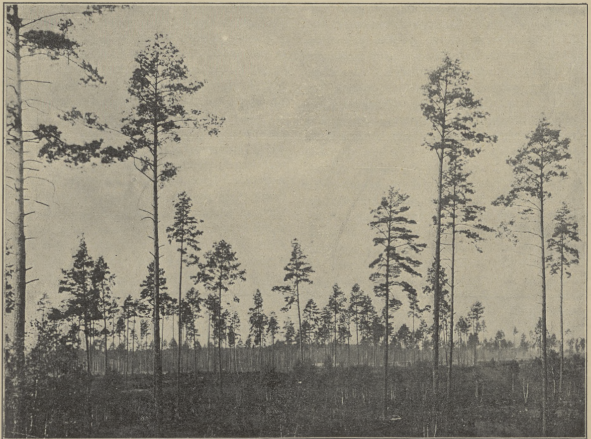
POREBA „WYLISIE“ (GALICJA WSCHODNIA).