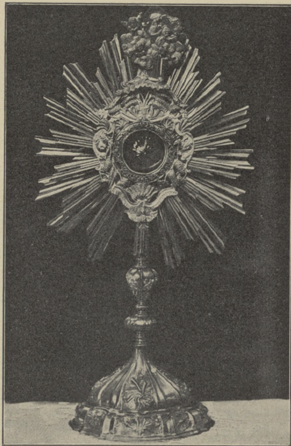
MONSTRANCYA SREBRNA Z XVIII W. W KOŚCIELE SW. PIOTRA I PAWŁA W WILNIE.