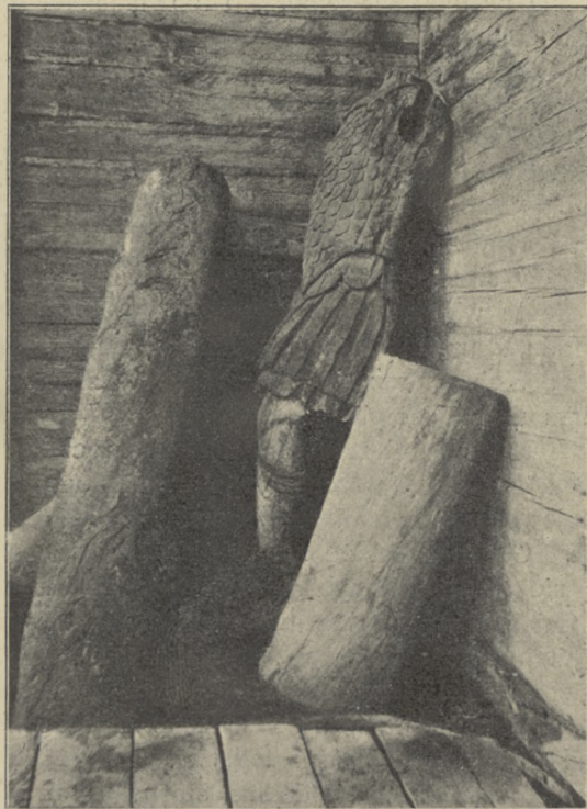
FIGURA RYCERZA, WYDOBYTA Z BEREZINY.

Królewicz Władysław, zamierzając przysłużyć się Litwie tym pożytecznym czynem zaoferował się ponieść kosztą dokonania tej pracy z własnej szkatuły, z warunkiem późniejszej spłaty ich z ceł pobieranych. Projekt ten został r. 1631 przyjęty przez sejm warszawski, uzyskując konstytucję pod tytułem: „Przekopanie nowego portu z niżu Berezyny rzeki do Wilii“.