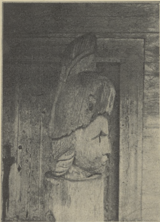
fol. H. Słizniówna.

Tędy, dopóki Polesie było nieprzebytą topielą, (przed przeprowadzeniem kolei poleskich) kierować się musiał ruch handlowy lądowy od Litwy i Polski ku Rosyi oraz wszelkie wyprawy