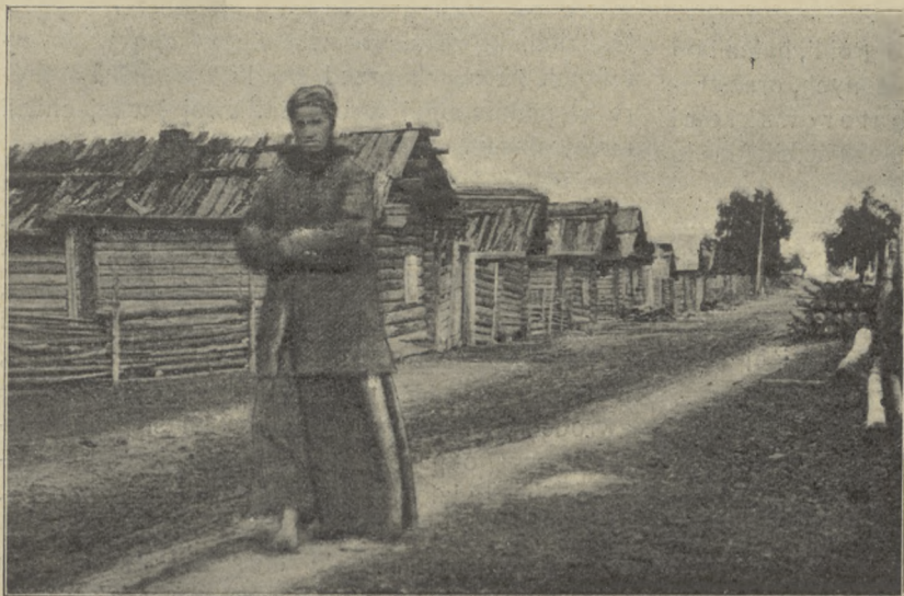
ULICA W STUDZIONCE.