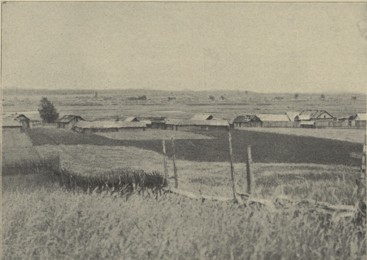
MIĘSCIE PRZEPRAWY WIELKIEJ ARMII. NA 1-SZYM PIANIE WIEŚ STUDZIONKA, DALEJ ZA RZĘKĄ — BRYLE.