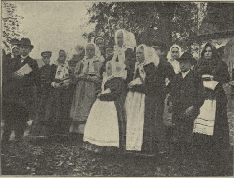
TYPY LUDOWE Z DĄBRÓWKI.