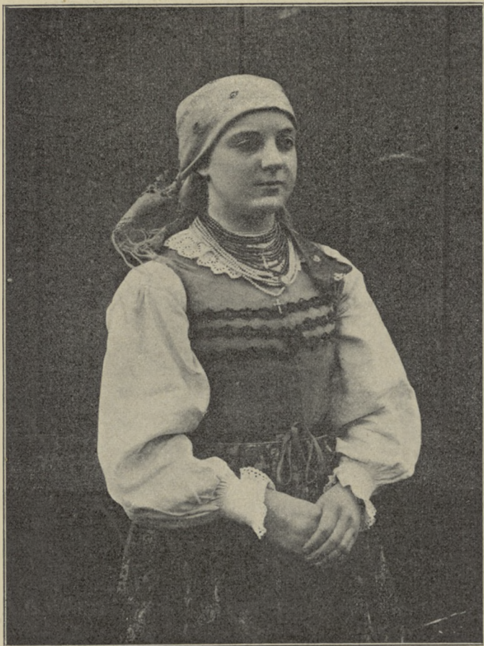
fol. ze zbiorów St. Graevogo. GOSPODYNIA Z KAMIONACZA, POW. SIERADZKI,

użytku szerszego ogółu lecz i dla własnych członków udostępnić być nie mogą.