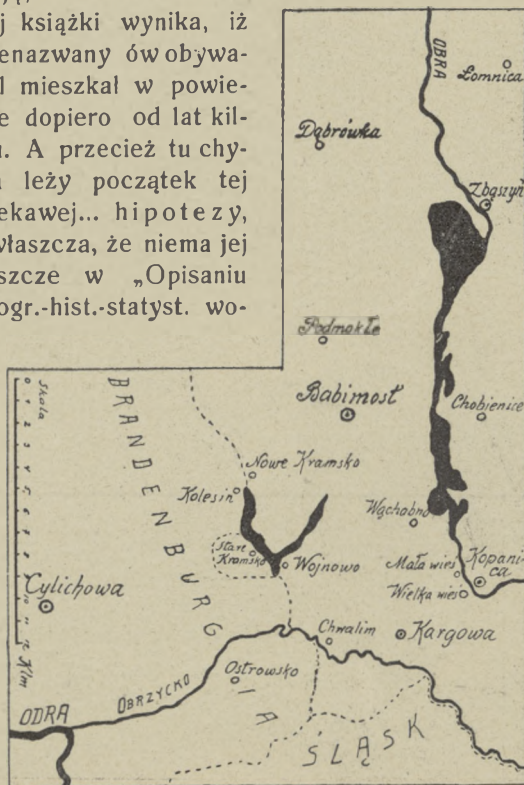
MAPKA OKOLIC CHWALIMIA.

bez podania źródła. Natomiast nic nie mówi o Chwalimiu ani wogóle o emigracji z Dolnych Łużyc w czasie wojny 30-letniej K. A. Jencz w odpowiednim rozdziale (str. 49—81) pracy „Stawizny serbskeje rycze a narodnosće“ (Czasopis Maćicy serbskeje, IV—V, 1851—52). Nie wiedział jeszcze widocznie, że „Opisanie historyczno-statystyczne Wielkiego Księstwa Poznańskiego“ (Lipsk 1846) ma na str. 188 następujący odnośnik: „Wieś Chwalim jest jedyną w całym powiecie przez Słowian wyznania luterskiego zamieszkałą. Są to Łużycanie czyli Wendowie z Dolnej Łuzycy. Gdy po najazdach szwedzkich kraj został wyludniony, przybyli między innymi osadnikami Wendowie, założyli osadę oddzielną, nie łącząc się z Niemcami, mimo wspólnego wyznania. Dotąd zachowali dialekt właściwy, do polskiego zbliżony. Modlą się na książkach polskich, gotyckimi głoskami drukowanych, i należą do parafii w Kargowie, gdzie dla nich co dwa tygodnie odbywa się luterskie nabożeństwo w języku polskim. — Wiadomość udzielona przez obywatela w powiecie zamieszkałego“. Dla charakterystyki braku pozytywnych dowodów tej wiadomości dodaję, że ze str. 175 tej książki wynika, iż nienazwany ów obywatel mieszkał w powiecie dopiero od lat kilku. A przecież tu chyba leży początek tej ciekawej... hipotezy, zwłaszcza, że niema jej jeszcze w „Opisaniu jeogr.-hist.-statyst. wo-