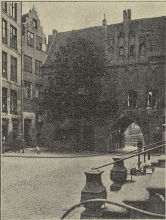
BRAMA ULICY BROTBÄNKERGASSE W GDAŃSKU.