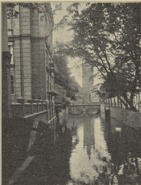
„AM SANDE“ W GDAŃSKU

nego opuszczenia, zastają przeciwnie sień wchodową urządzoną z wykwinną prostotą, pełną starych pięknych mebli gdańskich. Dowiaduję się, że tu mieszka pastor kościoła św. Katarzyny, archidyakon Blech. Po chwili rozmawiam już z uprzejmym starszkiem, który mile zdziwiony, że ktoś zwrócił uwagę na jego domek, prowadzi mnie do środka.