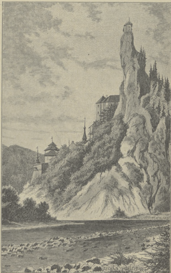
rys. Walery Eljan.

Wszelako, cokolwiek stwierdzimy o gwarze tej lub owej wsi, jakkolwiek ostatecznie rozstrzygną tę sprawę badacze języka, rzeczą niewzruszoną zostanie jaskrawo uderzające zjawisko, że przeważna część ludności w Tatrach