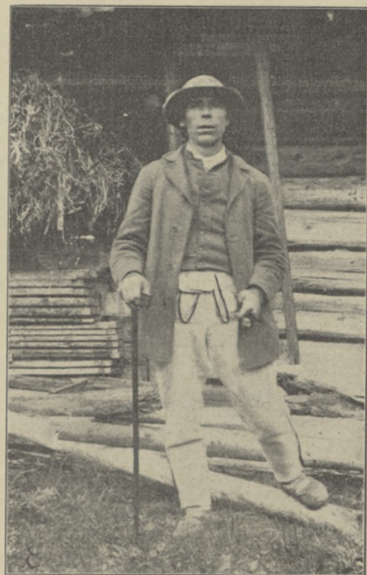
fol. E. Stercula.