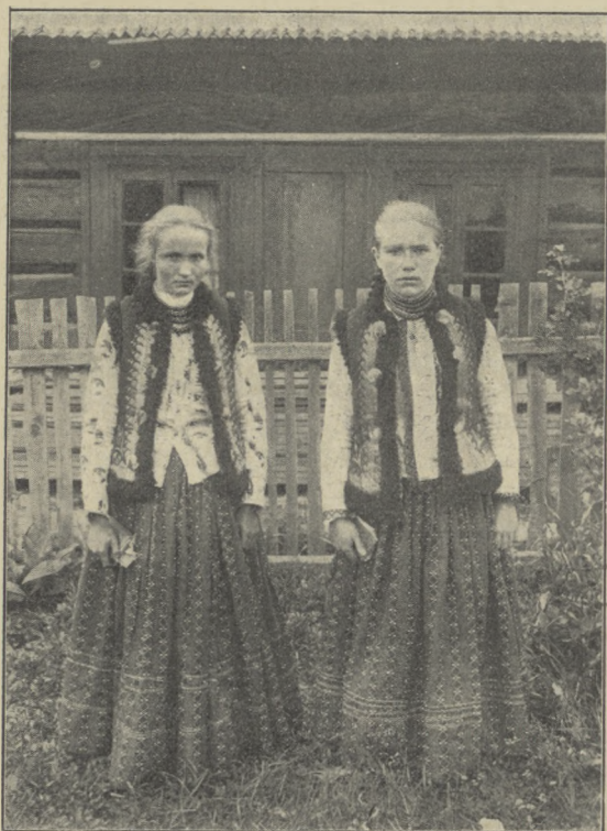
DZIEWCZYNY Z PIEKIELNIKA.