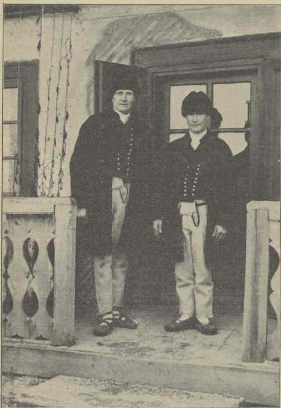
fol. E. Stercula.