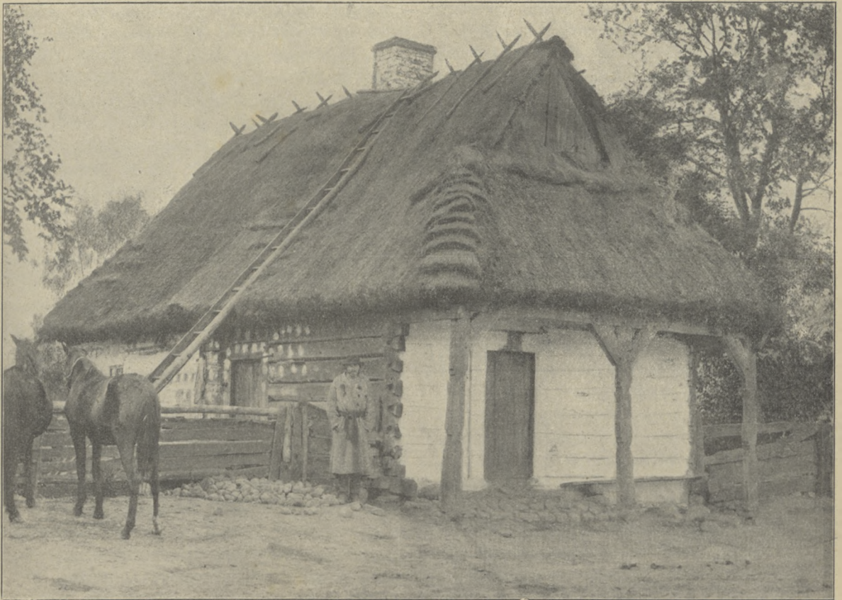
fol. II. Włocławski.