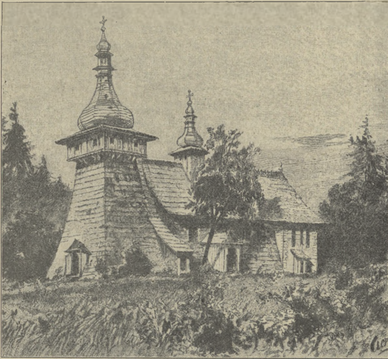
KOŚCIOŁEK W ORAWCE.

sklepienie niebieskie, błyszczące tysiącami gwiazd brylantowych, wokoło zaś zbliżka i zdaleka jarzące się w płomieniach sobótek rozczochrane czola pagórków i dolatujące chwilami tęskne piosenki lub wesołe wykrzykniki przejętej uroczystością młodzieży, a nakoniec pocziwe staropolskie dudy i krzykliwą piszczałkę, które nie wiem, skąd się tu wzięły o tej porze, — pojdziesz łatwo, że wesołe i gwarne towarzystwo uciszyło się zwolna, zajęte ślicznym widokiem, a każdy zajęty własnymi myślami i uczuciem“. — Poza tem w czasie pomiędzy Bożem Narodzeniem i Zapustami można być świadkiem różnych charakterystycznych zabaw ludowych. Pomiedzy Bożem Narodzeniem i świętem Trzech Króli chodzi kozieł i bodzie, albo młodzieńcy przebijają się za niedźwiedzia, konia, kozła, bociana i taką gromadą odwiedzają chaty. Po Trzech Królach mali chłopcy przebijają się jako królowie z koronami i obchodzą chaty, przytem jeden z nich osmolony sadzami, jako murzyn. Przed Bożem Narodzeniem w czasie adwentu i kilka tygodni po niem chodzą z szopką. Często są to dorośli parobcy, którzy cały powiat kolejno zwiedzają, śpiewając swojskie kolendy, a czasem i „frantówki“. Chodzą po dwóch albo trzech, z których jeden niesie szopkę, a dwaj pozostali — dary, otrzymane od gburów, składające się z wiktuałów i pie-