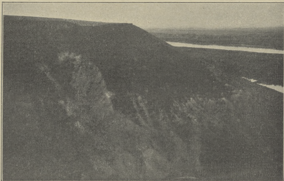
fol. ze zb. Pol. Tow. Kr.

Zarówno, jak Nalkowski, Romer wytyka dla Polski wielkie stanowisko geograficzne i potężną rolę dziejową. I jak Nalkowskiego przejściowość, powodująca upadek Polski, tak Romera pomostowość prowadzą do wyników pesymistycznych. Jeżeli dawniej mawiano: bez Polski nie ma Rusi, to teoria Polski jako między-