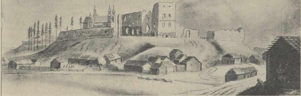
LUCYN W XVIII W.