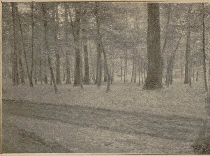
REZERWAT W NADLEŚNICTWIE WARTY, ZAPROWADZONY OD R. 1907. POW. WRZEŚIŃSKI

bardzo ograniczonym kawałku ziemi, prócz tego w pewnej miejscowości powiatu szremskiego, wreszcie w powiecie międzychodzkiem. Piękno i lekkomyślność często chodzą w parze. Lekkomysłne gwoździki z pagórka rozeszły się aż ku drodze, zapewne, by oglądać podczas Zielonych Świątek pięknie ubranych przechodniów. Przechodnie spostrzegają te kwiatki, zrywają, albo wprost wrywają z korzeniami, a nawet wchodzi na pagórek, by tam je sobie odnaleźć 1) , zaczęły więc one coraz bardziej znikać, aż wreszcie władze leśne wzięły te kwiaty pod swą opiekę (1911).