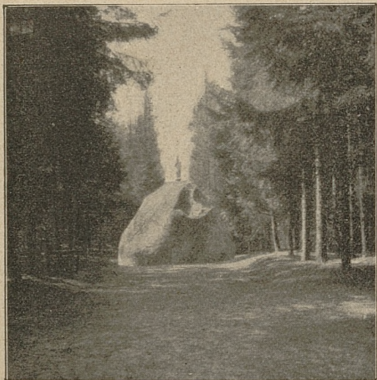
GLAZ JADWIGI NIEDALEKO GOŁUCHOWA, POW. PLESZEWSKI.

rośla krzewiaste, ulubione przez ptaki, gdyż niektóre gatunki ich spotyka się coraz rzadziej.