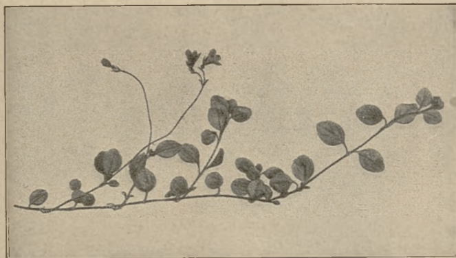
ZIMOZIOŁ (LINNEA BOREALIS).

Przejdźmy teraz do tych roślin niższych, które jako rzadko występujące stanowią klejnoty naszej flory ojczystej. Takim klejnotem jest mała roślinka, czołgająca się po ziemi z drobnymi listeczkami i kwiatkami w postaci dzwoneczków. Nazwano tę roślinę zimoziółem— Linnaea borealis , dla uczczenia pamięci Nestora botaników 1) z przymiotnikiem borealis (północny), gdyż im dalej ku północy, im zimniejszy klimat, tem lepiej się ona rozmnaża i rozwija. Spotyka się ją u nas tu i owdzie kępami wśród darni lub otaczającą nikłymi pędami podstawę pni. Nie jest ona u nas zaklimatyzowana — kwiat jej nie wydaje nasion, nie może się więc tu rozpowszechnić. Jest to więc przybysz, którego na-