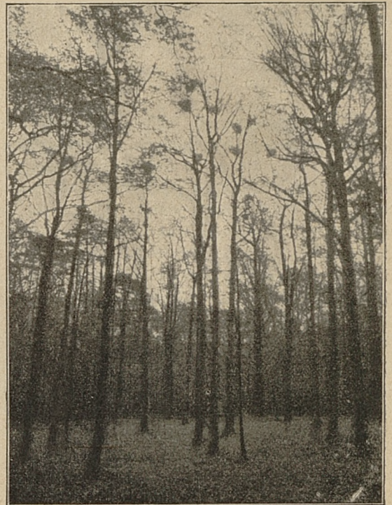
CZAPLE GNIAZDA W LESIE WŁOSZAKOWICKIM, NIETYKALNE OD 1912 R. W POW. WSCHOWSKIM.

Niedaleko od kolei spostrzegamy malowniczo zarośniętą dębnią pagórkę, na których prócz gruszy mącznej rośnie bardzo rzadki storczyk wązkolistny, którym zarząd leśny za-