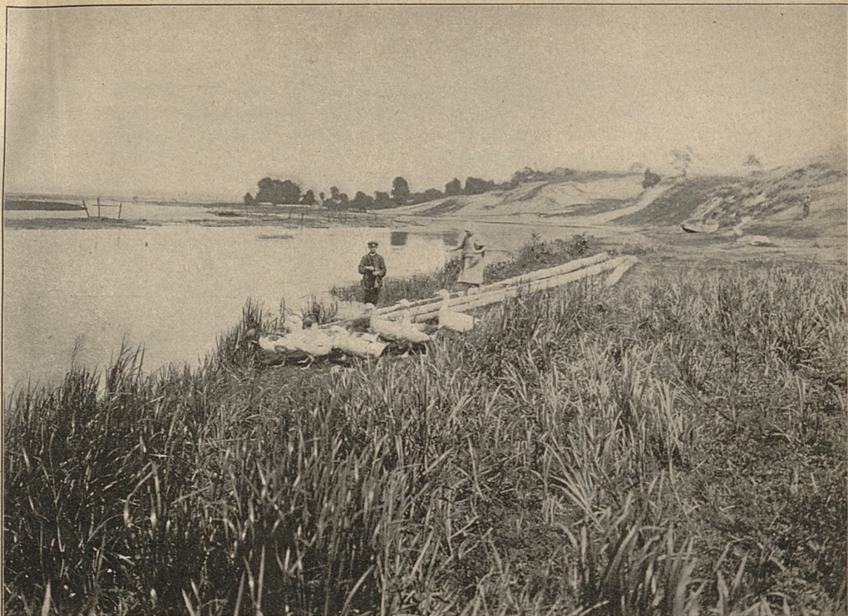
fol. Ad. Chętnik.