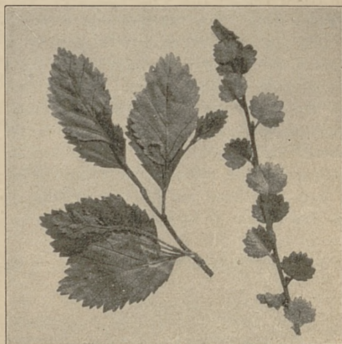
BRZOZA NIZKA — BETULA HUMILIS (Z LEWEJ STRONY); BRZOZA KARLOWATA — B. NANA (Z PRAWEJ STRONY).

W Księstwie Poznańskim znane są one tylko w trzech stanowiskach. Na stromym brzegu jeziora w Górcie i to tylko na