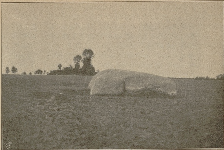
KAMIEŃ ŚW. WOJCIECHA W BUDZIEJOWCU POD MIECZYSIEM, POW. WĄGROWIECKI.

opiekował się od r. 1911. Kwiat tego rzadkiego storczyka prędko przekwita i opada. Roślina ukrywa się wśród ogólnej zieleni przed okiem wandali. Tu stwierdzić należy, że im większy obszar oddany jest dozorowi urzędowemu, tem lepiej jest zabezpieczona nasza flora i fauna; takim właśnie rezerwatem; nazywamy obszar ziemi strzeżony przed niszczącą ręką człowieka dla zachowania następnym pokoleniom pamiątek flory ojczystej. Posiadamy podobny rezerwat i w Księstwie Poznańskim, w nadleśnictwie Warthewaldzkim pod wsią Orzechowem w pow. wrzesińskim. Istnieje on już od r. 1907. Obszar ten jest niewielki, i nawet nazbyt mały, gdyż wynosi zaledwie \frac{3}{4} hektara, mimo to rośnie tam dużo gatunków drzew liściastych, a mianowicie: klon polny, jawor, grab, brzoza korkowa, jesion, dąb, trzmielina, szakłak kruszyna, dereń, głóg biały i inne. W rezerwacie tym chodzi więc głównie o drzewa liściaste. Byłoby jednak do życzenia, żeby założono podobny rezerwat i dla drzew iglastych; należałoby też w pewnych okolicach zachowywać lub też nawet sadzić za-