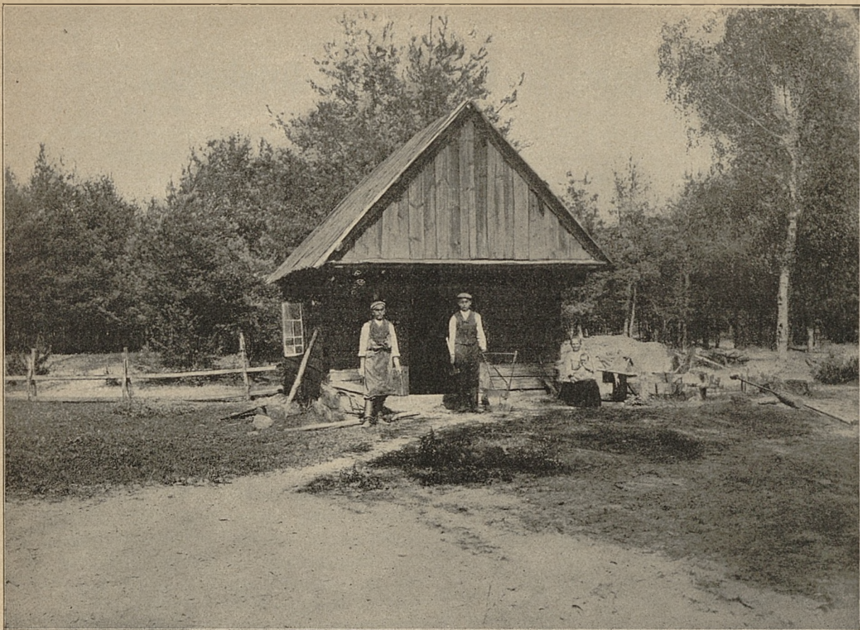
KUŹNIA W LESIE POD WSIĄ SERWETKAMI, POW. KOLNEŃSKI.