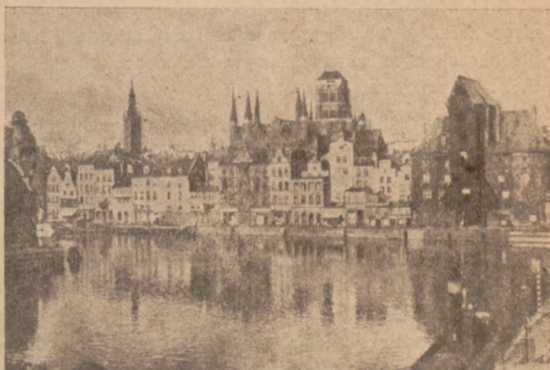
Gdańsk. „Długi Most”.