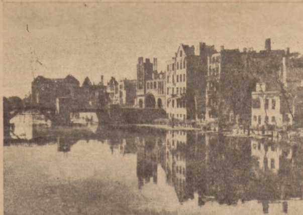
Gdańsk. Motława i Długi Most obecnie.

W Krakowie brak ich zupełnie, w Warszawie i Poznaniu są one niezbyt szczęśliwym wyjątkiem (Kollątaj i Paderewski). Brak ich także było prawie zupełnie w niemieckich planach Szczecina, Gdańska lub Wrocławia. Zarówno Szczecin jak i Wrocław uzupełniły ten „brak” w polskim planie, lokując po kilkanaście nazw odosobowych w swym starym mieście, z których na dodatek większość z tymi miastami nie ma n.c. wspólnego. Największy takt w tej sprawie wykażal niewątpliwie Gdańsk, który skromnie, ale rozumnie ograniczył się na obszarze swych kilku „starych miast” do tłumaczenia nazw niemieckich, a autorom