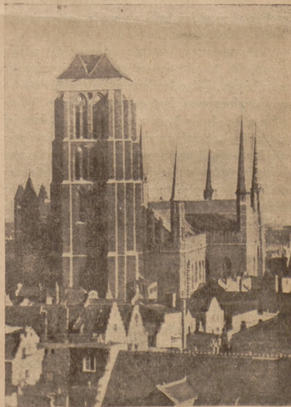
Gdańsk. Kościół P. Marii (stan przed wojną).

du i w pięknie bogatych szczegółów się ukazują. Porządkująca myśl i starania dbałych o ratunek i zachowanie resztek mienia kulturalnego z przebogatego skarbcza architektury i sztuki gdańskiej dobywają tu spod gruzu ułamki gzymsów i rzeźb. Co ozdobniejsze,