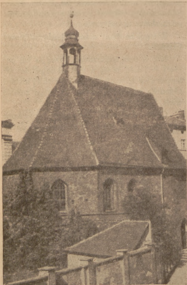
Wrocław. Kościółek św. Marcina. (Przed wojną).

Gdy przechodzeń zabląka się w labirynt uliczek Ostrowu Tumskiego we Wrocławiu,