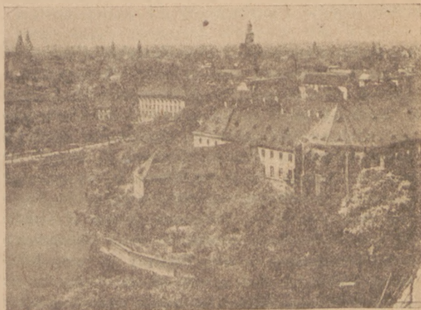
Wrocław. Śródmieście. Widok przedwojenny.

Inne zagadnienie to sprawa polskiej nomenklatury ulic w tych miastach, dla których brak w dokumentach historycznych, jakichkolwiek odpowiedników polskich. Jeżeli przypatrzymy się któremuś z współczesnych polskich miast, więc Warszawie, Poznaniu czy Krakowowi, zobaczymy, że udział odosobionych nazw ulic wynosi w obu pierwszych 18%, przy Krakowie zaś 27%. Przy Szczecinie natomiast skacze ten-