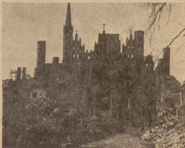
Gdańsk. Kościół P. Marii. (Stan obecny).

Cegły, dachówki, przepalone czerwone żelaziwo, zmięte blachy z miedzianego dachu