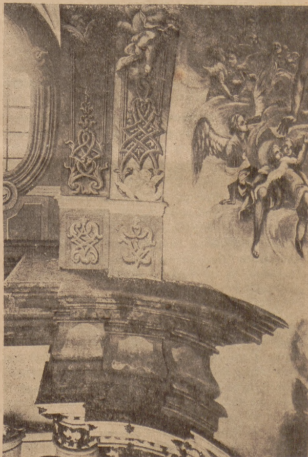
Kobylka. Kościół pojezuicki. Fragment gipsu w presbiterium.

„Kronika” stanowi organ Tow. Miłośników Stoł. Miasta Poznania. Za Komitet Redakcyjny podpisuje pismo Stanisław Strugarek.