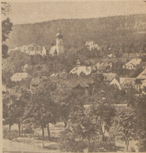
Puszczyków (Polanica) w Kłodzkim na Śląsku Dolnym

ZJAZD UZDROWISKOWY. W dniach 18—20 maja odbywał się w Puszczykowie na Dolnym Śląsku (powiat Kłodzki) zjazd Sekcji Uzdrowisk Państwowej Rady Zdrowia.