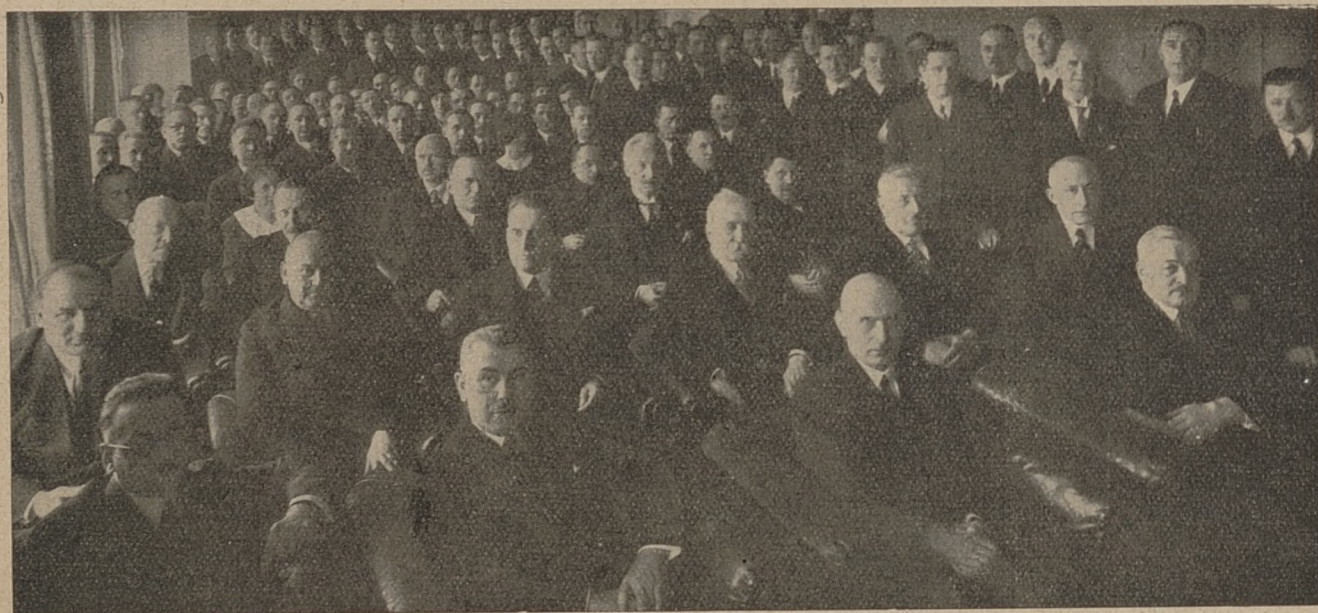
Moment otwarcia Zgromadzenia przy udziale przedstawicieli Władz Banku.