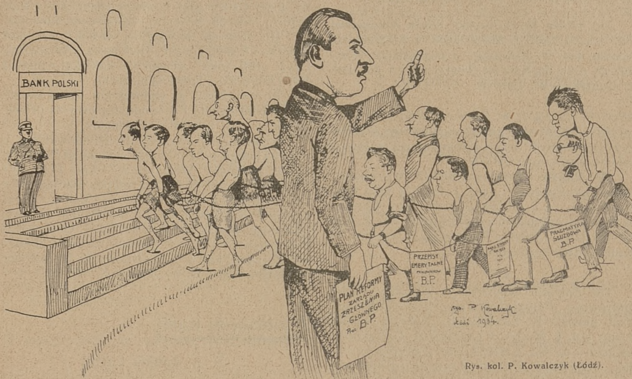
Rys. kol. P. Kowalczyk (Łódź).