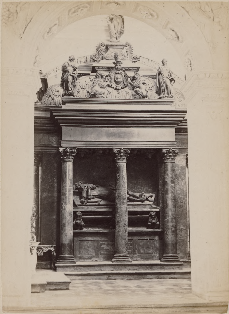
Pomnik Mikołaja Hieronima Sieniawskiego, hrabiego na Szklowie i Myszy, hetmana polnego koronnego, zmarłego w Lubowli 1683 r.