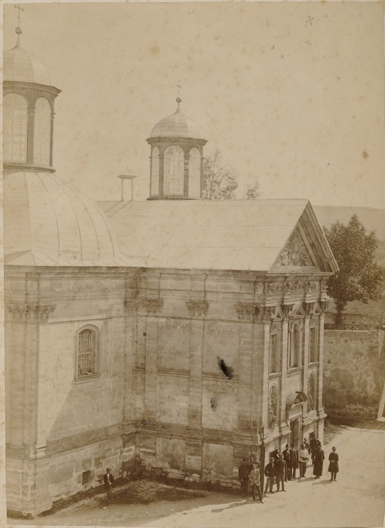
Kościół zamkowy Sieniawskich w Brzeżanach.