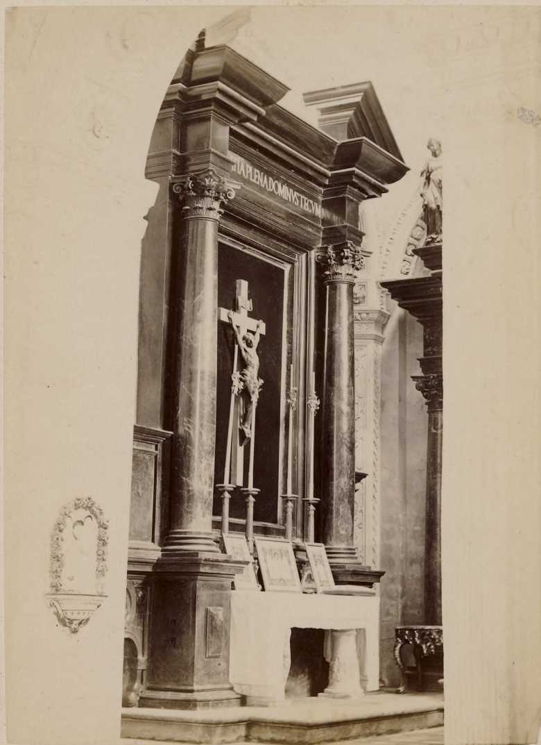
Widok ołtarza prawej nawy.