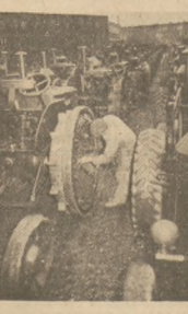
Wyprodukowane w czynie I-Majowym ełkaniki „Urusa” poszły za chwilę teni fabryki.

Na odcinku największym postępowe formy produkcji różniczek transportowych Ośrodków Maszynowych do wykonania specjalnych zadań. Kiedyś obłudnik uważał, że nie potrzebna mu maszyna czy ciągnik, bo miał tania siłę roboczą — marmolionego chłopia lub wyrobniaka. Dziś ten sam chłop buduje na wszystkich odcinkach naszego