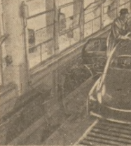
Coraz bardziej usprawnia się tok produkcji w FSO na Żeraniu, dzięki doświadczeniom przekazywanym tam przez radzieckich specjalistów. Na zdjęciu: nadwozie samochodu „Warszawa” na taśmie montażowej.

Na wezwanie — „Dać ludziom pracy więcej możliwości i samostanowienia. Podnieść ich jakość” —