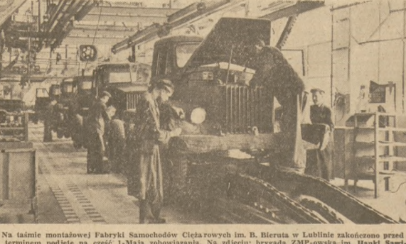
Na taśmie montażowej Fabryki Samochodów Cieża rowych im. B. Bieruta w Lublinie zakończono przed terminem produkcję czesć I-Maja zobowiązania. Na zdjęciu: wydział ZMP-owska im. Hanki Sawickiej wykonuje dodatkową partię 5 samochodów „Lublin”.

Wśród wielotysięcznej rzeszy pracowników naszej motoryzacji na czołowe miejsca wywiązują się podobnie jak to ma miejsce w szeregach naszego wojska, we wszystkich dziedzinach gospodarki racjonalizatorzy — kierowcy i statystycy, przewodnicy Partii. Nie brak ich w Państwowej Komunikacji Samochodowej, w wielu przedsiębiorstwach mieszkalno- i przemysłowych. Wielu z nich przebiegalo również zmuszenie oszczędności materiałów pędnych. Kierowcy Śląskich Linii Komunikacyjnych osiągnęli nawet ponad pół miliona kcal, bez naprawy głównej. Racjonalizatorzy — kierowcy i mechanicy używający systematycznie poważnie oszczędności, dzięki zastosowaniu własnych pomysłów, w codziennym trudzie codziennej walce o plan, wykują się najczęściej jako materialnie socjalistycznej gospodarki — kadry. Walka ta nie się ośmieszka kosztów własnych, likwidację marnotrawstwa, podniesienie wydajności pracy i oponowanie nowej techniki. Walka ta jest jednym realizowaniem historycznych uchwali II Zjazdu Polskiej Zjednoczonej Partii Robotniczej.