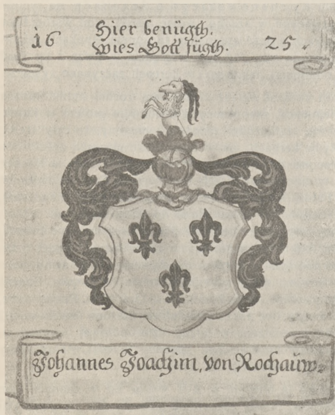
Herb rodziny v. Rochow.

Rękopiśmienny herbarz polski z XVI wieku, przechowywany w Bibliotece ord. Zamoyskiej, p. t. „Arma baronum Regni Poloniae“ podaje herb „Spirschala“ „quae Rochum sive maschalcum nigrum in campo albo defert“ 52 ). W rękopisie paryskiej biblioteki de l’Arsenal, zatytułowanym „Aquila Alba“, jest również podany herb „Pirzchala“ z objaśnieniem, że przedstawia on „calculus latruncolorum dictum Roch nigrum in campo albo“ 53 ). W aktach sądowych z XV wieku czytamy o występujących w nich członkach rodu „Pierzchałów“: „proclamationis Pirzchala et isti gerunt Rocha in clipeo“ 54 )