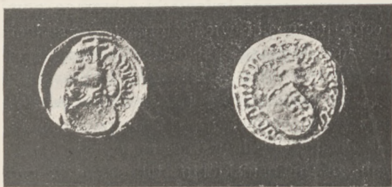
Pieczęć Wańka z Kwasitowa (r. 1454)

trzech innych, dochowanych również pieczęci, okrągła, drobnych stosunkowo wymiarów (o średnicy 21 mm.) przedstawia pieczęć powyższa mimo poważnych uszkodzeń samego zabytku, ujęte w całości bardzo wyraźnie i plastycznie — pełne wyobrażenie herbu Kierdeja. Tarcza, ułożona pochyło w części dolnej pola pieczęci, pionowo przez środek przepołowiona, z polem prawem czystym, w lewym wyobraża trzy lilje ułożone jedna nad drugą. Na lewym kancie tarczy osadzony hełm w profilu, zdobny w labry po bokach i uwieńczony koroną, na której umieszczony klejnot herbu — krzyż tkwiący między dwoma strusiami piórami. Na wstędze otokowej, przerwanej dwukrotnie: u góry przez wizerunek klejnotu, u dołu zaś przez spód tarczy — drobny napis wyrażony w gotyckiej