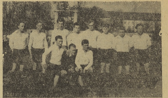
Niezbyt szczęśliwie wystartowali w tegorocznych rozgrywkach piłkarze koszalińskiej Gwardii, przegrywając wysoko swój pierwszy mecz ze złotowską Spójnią 1:4. Następne spotkania przyniosły dwa zwycięstwa, jednak Gwardia zajmuje dopiero 5 miejsce. Na zdjęciu: Piłkarze Gwardii Koszalin.

Komitety organizacyjne pracują już niemal we wszystkich powiatach. Najgorzej wygląda praca przygotowawcza w Białogardzie, gdzie do końca ub. tygodnia nie wyłoniono Komitetu Organizacyjnego. Zarząd Powiatowy ZMP oraz PKHF winny dopilnować, aby praca w tym powiecie ruszyła jak najwcześniej. Czasu nie zosta-