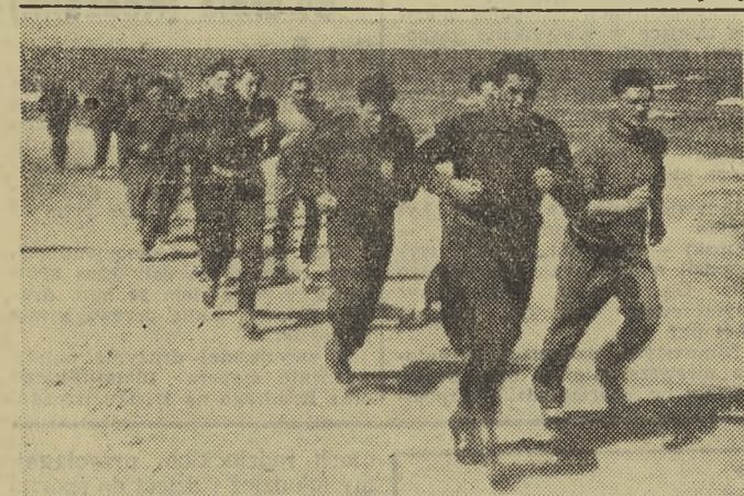
Na zdjęciu: Poranna zaprawa pięściarzy przebiegających na obóz przygotowawczym w Cetniewie przed mistrzostwami Europy w boksie.