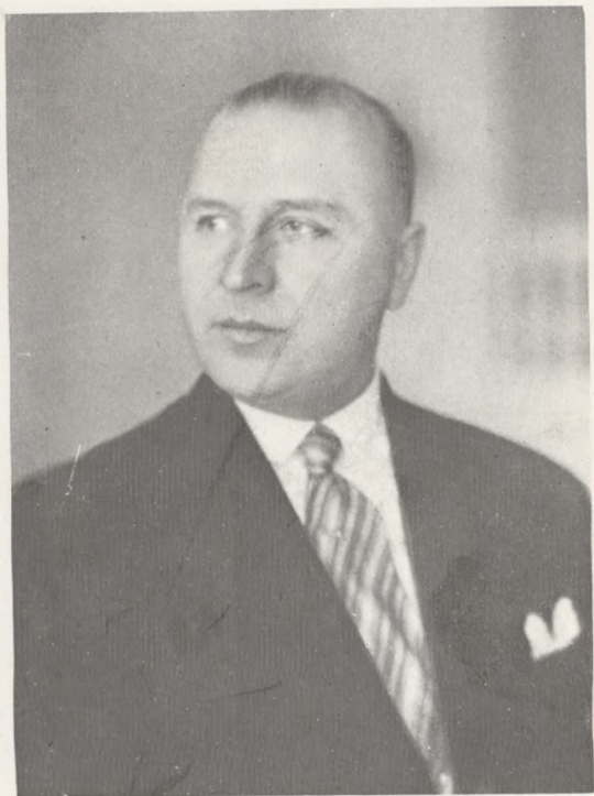
STANISŁAW CAR Minister Sprawiedliwości