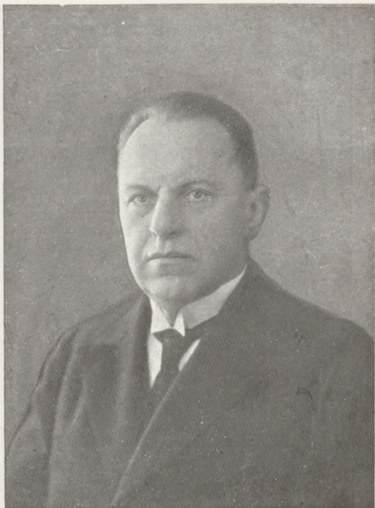
JÓZEF PROKOPOWICZ Pierwszy Prokurator Sądu Najwyższego