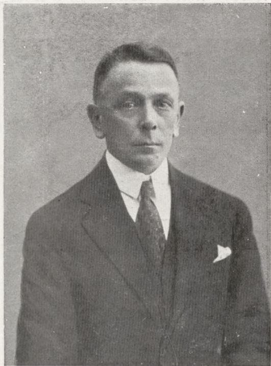
LEON SUPIŃSKI Pierwszy Prezes Sądu Najwyższego