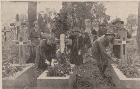
Пластова молодь садить квіти на стрілецьких могилах в Станиславові.

Не остав позаду і Станиславів. Маючи за собою велику, ще недавню традицію, Станиславівський воєнний цвинтарик упорядкований зразково і на кожному кроці помітне там уважливе око проводу. Станиславівський виділ Тов. Охор. Воєн-