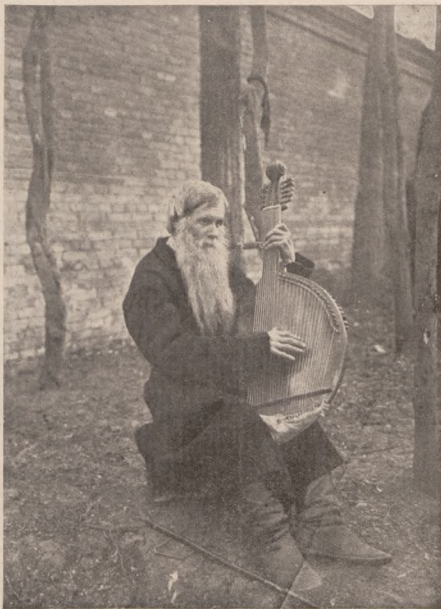
Бандурист, який грав Січовим Стрільцям у Києві в касарні при Терещенківській вулиці в лютому і березні 1918 р.