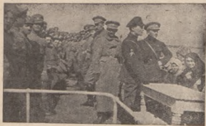
І-ша сотня С.С. на парохіді в дорозі до Канева мі- ста перед роззброєнням С. С. Німцями в 1918 р.

шов живим. В полон брали Стрільці лише гетьман- ських Серюків.