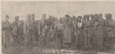
Перші російські полонені, взяті в полон У. С. С.-ами в 1914 р. в Карпатах.

нула стежа зі села і донесла, що в селі Москалів нема і що можна буде заквартируватися наніч у священника. На таке кожний схопився на рівні ноги, бо яснів йому солодкий відпочинок на сухім сні. Ми рушили. Через якісь городи, плоти, і щераз городи і щераз плоти. Вкінці дійшли ми над беріг річки. Річка невелика, але