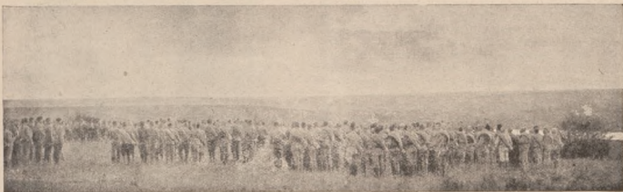
Запорізька Дивізія полк. П. Болбочана на острові Хортиці в 1918 р.

що рясно очеретами та чагарником позаростали так, що й шлях до нього тяжко відшукати. На острові луг невеликий блакитними, жовтими та червоними квітками в літі вкритий, а в зимі глибоким снігом, що відбиває блакить неба.