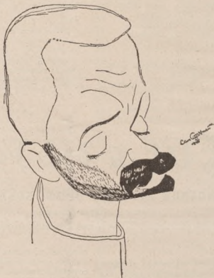
З теки карикатур Осепа Сорохтея: Проф. І. Боберський, батько українського спорту і мама української військової терміналогії.