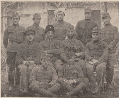
Старшини V/36 куріня на фронті в селі Сусидовичах коло Хирова в квітні 1919 р.