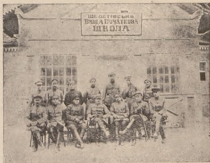
Штаб Корпусу Січових Стрільців.

Слово Мотовилівка ще й сьогодні розгойдує до не- бесажних вижин почуття втіхи й самовдоволення. Ще й досі дивною хлопачою радістю наповнюється душа, коли згадаєш, якій страшній небезпеці йшли ми на стрічу підчас першого бою в марші СС-ів на Київ