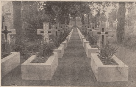
Стрілецький цвинтар в Станиславові.