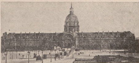
Виг. Дому Інвалідів в Парижі. Полуднева частина, в якій знаходиться Музей Армії. В глибині купола Храму Інвалідів.