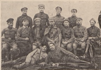
Недобитки стрільці і старшини з V/36 курія 2-ої коломийської бригади в колонії Гайсталь на Україні 10. III. 1920 р.