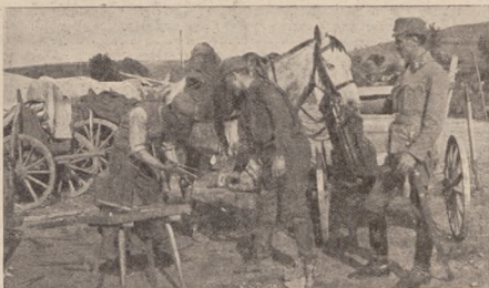
Зі стрілецького побуту: Кують коня. Соснів 14. VI. 1916 р.

Та недовго довелося спати. Знову пущили дощ і зимні каплі побудили нас. Та саме на той час вер-