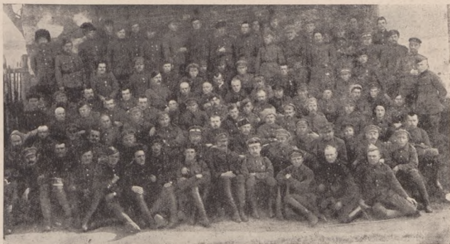
Старшини Запорізького Корпусу 10т. Болбочана.

тарні. Знов подали команду „праворуч, кроком руш”.