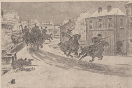
З історії Чорноморського Кінного Дивізіону. Наскок на Деміївку, передмістя Київ. — Мал. Л. Перфещкого.

Щодо поширення організації у війську, то позначилося дуже цікаве явище, характеристичне зрештою для всього революційного руху. Оскільки молодіші старшини охоче йшли в ряди Товариства, без застережень віддаючи себе до його розпорядження, то наявність в нім старших старшин була явищем дуже а дуже рідким, принаймні в Харкові. В більшості випадків старша старшина — командианти полків, куріні, старша старшина штабів VII корпусу й 12 дивізії, що стояли в Харкові, складалася коли не з явно московських, то найбільше з малоросійських елементів. А та частина її, що вважала себе за Українців, в більшості була мало активною, національним революційним рухом не проинялася, розмахом національного руху була просто заскочена. Коли вона й брала участь в національно-державній праці, то це виглядало на якусь ласку й безперечно погірдливе трактування «недосвід-