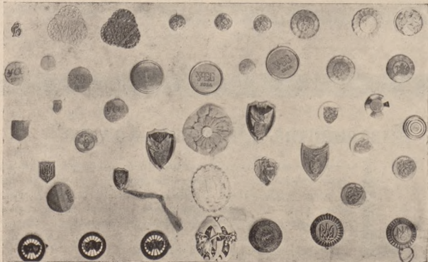
Збірка стрілецьких відзнак в Музею Наук. Т-ва ім. Шевченка у Львові.

канцелярійні книги, печатки, акти, оповістки та всякого роду особисті документи. Кожна річ повинна мати свою метрику, себто записку про її походження, ціль, та час зроблення чи вживання, бо часто сам собою незамітний предмет стає саме через таку метрику важною історичною памятою чи документом. Без такого пояснення стає прим. і найліпша фотографія вповні безвартісною, а кожна інша памятка мертвим, нічо не кажучим предметом. Таких цікавих памяток, нерідко великої історичної вартости, є ще досить у наших бувших старшин та стрільців, головню членів вищих команд, що мали кращу змогу переховати їх. Найліпшим доказом на це твердження є залучені знимки стрілецьких відзнак та печаток, скомплетованих у збірках Музею Наук. Т-ва ім. Шевченка у Львові.