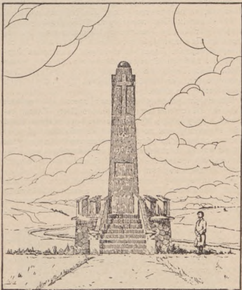
Пам'ятник поляглим Чортківщини.

Кому доведеться їхати через Чортків, нехай ми-наючи стацію в напрямі Копичинців погляне через вікно вагону, а побачить високу колоуму цього па-м'ятника.