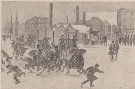
З історії Чорноморського Кінного Дивізіону. Ліквідують бунт. — Мал. М. Перфецький.

їнців. Впроваджено вільне мливо та видано приказ до заряду дібр гр. Потоцького, щоби по знижених, комісаріатом установлених цінах, видавав населенню дрова на опал та будіалу. Всі уряди державні, автономічні і повітові занято. В суді заявили урядовці Поляки, що не підчиняться Українській Національній Раді і опустили службу. Президентом суду установлено рад. двору Каратницького. На пошті повнять службу урядовці в давнім складі з тим, що до телеграфу і телефону пзкликано українські сили. Начальником податкового уряду є Українець рад. Буско. В старості перенато 100.000 К. а в господарській та рілничій експозитурі 104 тисяч К. Управу будельної експо-