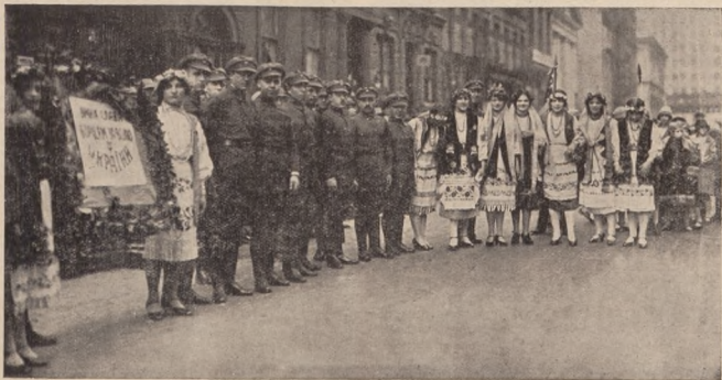
Обі знімки представляють маніфестаційний похід Українців в Нью-Йорку. В поході брало участь понад 5.000 Українців. На чолі походу бувші воєни У.Г.А. в одностроях демократичного Т-ва „Січ“.

Коли по катастрофі У.Г.А. розсипалися українські землі, попадаючи в різні займанщини, тоді дежким, що