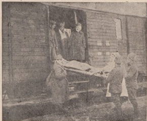
Санітарний потяг в часі боїв під Львовом, зима 1918 р.

Одного дня він в Підберіцях, другого в Каменополі, то Ляшках королівських, їздив від села до села, парив, купав, відвдушивлював по найбільшій часті цивільне населення, хоч і військові частини користали з його праці,