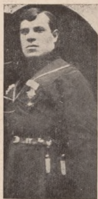
Кіннотич Зaporізького Корпусу от. Болбочана.

Болбочан замість спокійно виждати слухний час і заховати належний в його положенню час, перейшов в атаку на всіх тих, хто мав нещастя в той час репрезентувати Український Уряд. Ні чорнила, ні погрозиливих і образливих слів не шкодував розгніваний отаман у своїх листисних нападах на Петлюру, Осецького, Начальника Штабу Дієвої Армії і Команданта Січового Корпусу. Політичні партії вимагали від Головного Отамана суворого покарання Болбочана, яко виразного і відомого контрреволюціонера, що своїми виступами підірвав престиж Уряду і політичних угруповань. Директорія доручила політичному референту Осадного Корпусу Чайківському пере-