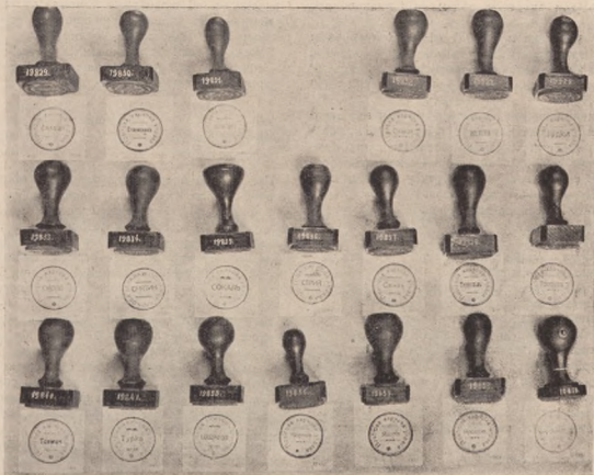
Збірка печаток повіт. харчевих управ в Музею Наук. Т-на ім. Шевченка у Львові.