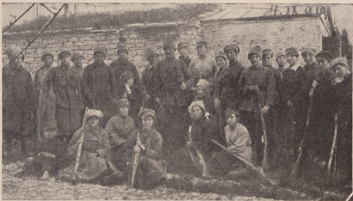
Окремий Залізний Загін з сот. Сіяком та хор. М. Кривіною.