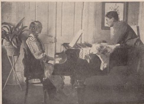
Воєнна ідилія (1916 р. над Стрипою)