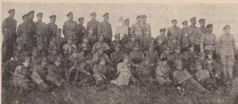
Штаб Запорозької Дивізії і старшини 2-го Запорізького полку на Хортиці.