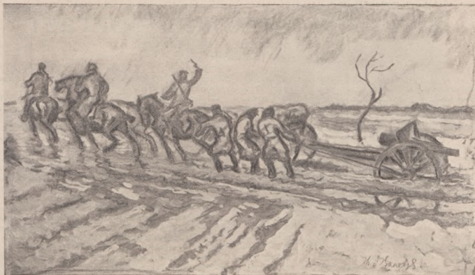
По болотистих дорогах.