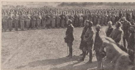
Присяга новобранців С.С. 18.IX. 1919 р. в Староконстантинові. Напереді стоїть Гол, От. С. Петлюра