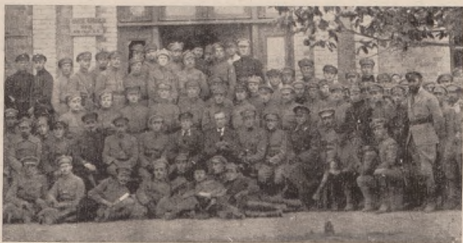
Гол, От. С. Петлюра зі старшинами С.С. в Староконстантинові 18.IX. 1919 р.

Це попувало дружні відносини між У.С.С. і С.С., які проганяли У.С.С.-ів, коли ці приходили арештувати. Мимо того багато стрільців з У.С.С. і Українців з австрійської армії дезертирувало до Гайдамацького полку Костя Гордієнка і др. ради тої свободи, яка була по