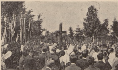
Панахида на стрілецькій могилі в Борщовичах.

І тому є невідкличчим наказом для Товариства Охорони Воєнних Могил занятися цією забутою, найважливішою на нашій землі могилою. Треба найперше поставити відповідну табличку на хресті, а там і побудувати могилу та хрест так, як цього вимагає пам'ять великих днів і національна честь. А могила повинна стати місцем паломництва для українського громадянства, а головою його молоді.