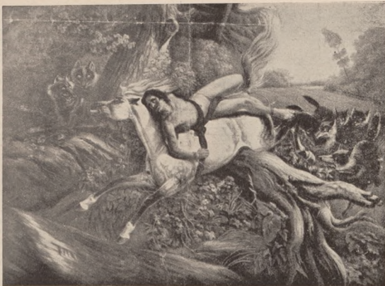
Мазепа. Образ Гораса Верне (H. Vernet 1789—1863) на мотив поеми Байрона, який знаходиться в палаті депутатів в Парижі.