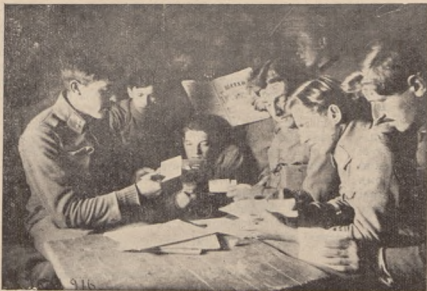
Пришла пошта! — Підстаршини і стрільці У.С.С. переглядають пошту 20.II. 1916 р.

Переводячи в життя цей план, дано наказ про відкриття Головного польового поштового уряду при Н. К. У. Г. А. та Команді Етапу, а польових поштових урядів при командах корпусів та бригад.