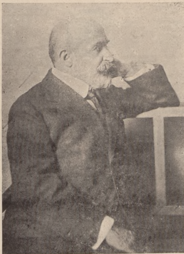
Граф Михайло Тишкевич, б. посол Уряду У.Н.Р. при Ватикані і голова української делегації при мировій конференції в Парижі. Помер 3.VIII. 1930 р.