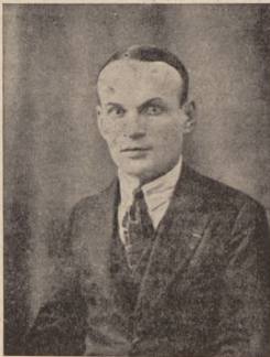
Полковник Шраменко, командант Бригади у Днівїї Юрка Тютюнника

Ліквідація тягнулася роками, а коли була закінчена, Тютюнника і його штаб розстріляли.