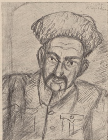
Полк. Сірко — повстанець З воєнних портретів В. Перейноса