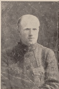
Отаман Юрко Тютюнник

До Української Армії Тютюнник прибув у літі 1919 р. під Жмеринкою, покинувши отамана Григоріва, з яким провадив повстанчу працю. С. В.