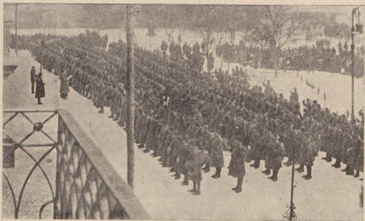
Присяга одного з коломийських курнів перед відходом в поле на ринку в Коломиї

статі і 9-та сотня почала наступати на Перзенківку та заняла була кілька хат, але під натиском польського протинаступу відступила назад. Тоді виставлено в наших окопах подвійні стійки, бо надіялися польського наступу. Смерком приїхали кухні та привезли борщі, кутю, вареники та сушені грушки. Почалася свята вечора, а по вечері роздавано святочні дарунки, які збрала Коломийщина. Кожний стрілець дістав дарунок. Зміст дарунку був різнородний. При кожнім дарунку був долучений календарик і картка з святочними бажаннями: „Веселих Свят“, а замість адрес на картках були написи „Борцєві за волю України“, „Героєві століди Льва і Данила“, „Стрільцєві Соколиків“, а крім „Веселих Свят“ написи „Борітеся — поборете“, „Не плачем а мечем“, „Не ридай — а добувай“, „Ти Боже поможи, а ти небоже не лежи“. А під тим підписи: „Дівчата Покуття“, „Коломийські дівчата“.