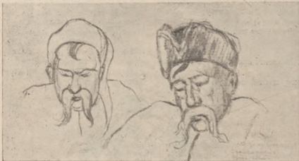
З воєнних портретів В. Перейбиноса — Козаки Черноморського Коша, Київ 1918 р.

Найближчою метою Вільного Козацтва було підтримувати здобутки революції: — Вільне Козацтво виконувало службу горожанської м'ліції, охороняло бушві панські маєтки від всякого бандитського елемента та від переходячих з фронту дезертируючих російських частин. Вільне Козацтво ви-