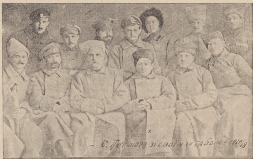
Головний отаман Симон Василеви́ч Петлюра (X) зі своїм штабом 1918 р.

день збройного захисту на провесні державного відродження. Гадати, що ми змогли в 1920 році побороти ворога збройно, без союзника, без матеріальної і моральної допомоги Європи — то була ілюзія тих чинників, що були захоплені об'єктивною стороною боротьби. Щастя наше, що більшовики погромили нас поблизу польського кордону. Колиб це