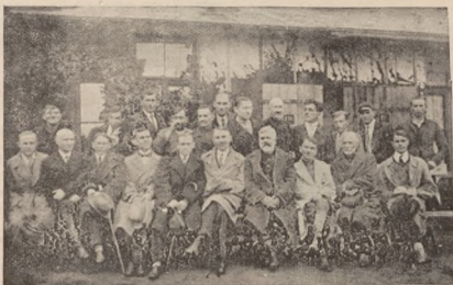
Командант лівої групи бойового фронту ген. Базильський (<X) з Запоріжцями (на еміграції)

Голодна, роздягнута, під дощем і снігом, по коліна в багні відходила наша армія до Збруча. Відходила вона організовано, боездатно, як той ранений звір, що не дається спіймати голими руками. Там, де більшовики осмілювались наблизитись до наших ариєргардів, козаки нагадували їм, що є ще порох в порохівниці. Дня 14-го листопада під Стодольцями Кінний Мазепинський Полк і Окрема Запівнічна Сотня потропили 533 совітський полк, захопивши сотню полонених. 16-го листопада Мазепинці розбили більшовиків під ст. Богданівкою. Команданта більшовицької бригади відомого Шинкаря козаки забили підчас бою. Чорні Запоріжці заатакували під. с. Галузницями бригаду