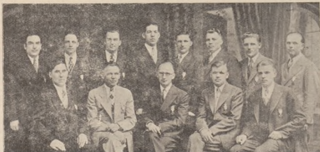
Стрілецький гурток у Філадельфії.

В Філадельфії Жіноче Товариство зробило гарні поступи в праці — своїми публичними виступами — а зокрема підготовленням Стрілецького Вечера на З'їзд Громади. За це належить Жіночому Товариству найвищого подяка.