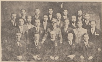
Стрілецький гурток у Дітроїті.

Вважаючи пластову ідею як незвичайно корисну у вихованню нації, ми і в минулому році вислали 16