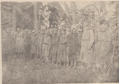
Сотня скорострільців з коша У.С.С. перед відходом з Косинковець в грудні 1919 р.