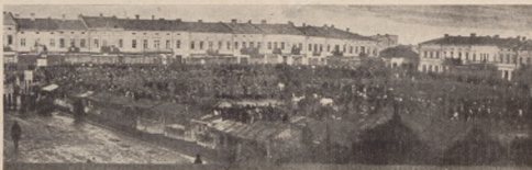
Свято зєднання України в Стрию 5. I. 1919 р.

Одною із перших постанов станиславівської сесії Української Національної Ради була ухвалена дия 3. січня 1919. р. про злуку Західньо-Української Народньої Республіки з Українською Народньою Республікою. Постановою про злуку була жаданням загалу та війська і перейшла на Національній Раді лиш під пресією публічної опінії, на чім соціалістична партія, яка найбільше побивалася за злукою, робила для себе капітал. Соціалісти сподівалися наслідком злуки стати в Галичині рішачим чинником хочби тому, що в Києві Директорія та Уряд були в руках соціалістів. Скоро по Новім Році стала організуватися делегація з рамени Української Національної Ради до Києва, яка малаби обовязок постанови УНРади офіційально передати наддніприському Урядові та есентуально навязати перші переговори в справі переведення злуки в життя. Головою делегації призначено містопресідателя УНРади