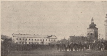
Свято зєднання України в Жовкві 7. I. 1919 р.

Розкинений на горбках Київ представився нам у своєрідній панорамі. На білім тлі сніжної шати то