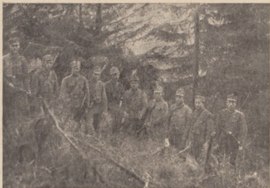
Пробовний відділ Гуцульської Сотні У. С. С. на Кирибабі

всєж це вам лекше прийде́ться, чим мені зачинати вчитися ще української команди в слові й практиці. Заки я її навчуся, для вас скінчиться речинець побуту в цій Деташмі і мені не доведеться побути спільно з вами, славними Українськими Стрільцями! Я вас цілим серцем полюбив, хоч недовго з вами пробуваю. Але вашу вартість я пізнав у мить. Я пізнав і те, що з вами силою нічого ніхто не вдіє, навіть я, котрий перевів уже 14 вишколів.