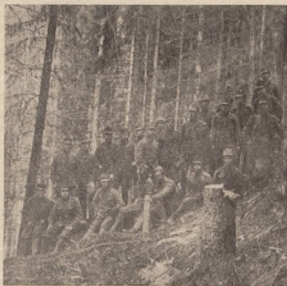
I. чета Гуцульської Сотні УСС. Березень 1917. Кирибаба

У цьому Кичунові чи пак М. Бичкові сотню приміщено на стоянках, по жидівських домах, яких тут було повнісью. Щодня ходила сотня на вправи. За