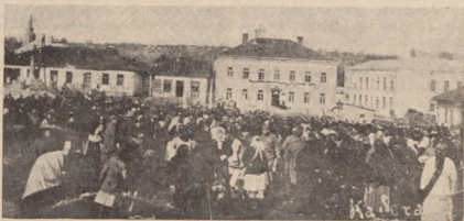
Проголошення української державности в Долині. Листопад 1918 р.

Вечером відбулися святочноі сходини в поміщеннях Українського Клубу, що громадили між своїми членами квіт української інтелігенції Київа. Клуб був за гетьманської влади замкнений, тепер знов став осередком товариського життя української інтелігенції. Сходини були присвячені привітання Галичан в столиці.