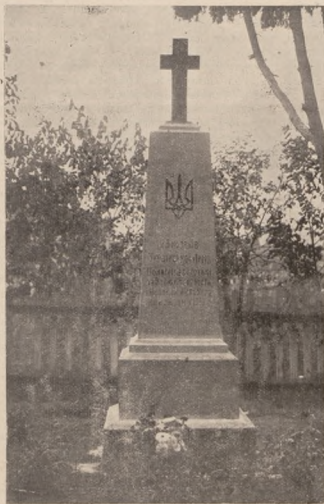
Пам'ятник на могилі 23 козаків полягалих за Волю і Незалежність України в лютому 1919 р. в містечку Костополі на Волині.

мом. Але якщо навпаки „всеросійська“ реакція до тієї справи не прилучилася, якщо вона в добавок ще й зверталася проти неї такою ж як і проти більшовизму — то тоді більшовизм ставав сильнішим від своїх ворогуючих між собою противників, і тоді ніщо не могло врятувати країни колишньої Російської Імперії разом з усією „всеросійською“ реакцією і з цілою східноєвропейською контрреволюцією з одного боку, а з другого разом з усіми сепаратистичними національними рухами перед тим, щоб отсих країни не приборкала влада совітів. Як передтим більшовики виставляли себе підчас боротьби проти Тимчасового Уряду за рішучих борців за „необмежене право народів Росії на самовизначення включно з відділенням“, а це в значній мірі уможливило їм їхню побіду над Керенським, так мусіла тепер „всеросійська“ реакція обернути цей дрючок другим боком проти більшовиків. Як більшовики щойно після своєї побіди над Тимчасовим Урядом узаяли за приборкання отого „права на самовизначення“, так повинна б теж і „всеросійська“ реакція, якщо б вона зберегла в глибині свого серця „неділану Росію“, взятися аж після закінченого знищення більшовизму в Москві й Петрограді за завдання привести більшість новоповсталих національних держав і автономних областей назад у якийсь більше чи менше тісний державний зв'язок з Московщиною. Але змагати до обидвох