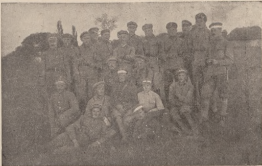
Старшини та підстаршини IV. курії 5. Сок. Бриг. УГА. Київщина. Вересень 1919 р.

Відсіля є цей неправильний погляд, що гетьмансько-українська база контрреволюції в ніякому разі без німецької окупаційної армії обійтись не могла і тому при всяких обставинах упасти мусіла в наслідок зсякнення боєдатності тієї армії на вістку про революцію в Німеччині. Приклад внутрішньої консолідації Донщини на протязі 1918-ого року показує,