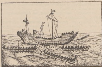
Козацькі чайки нападають на турецьку галеру.

зповідання Бопляна) загублювалася у воду також коло 2 м. 1 ).