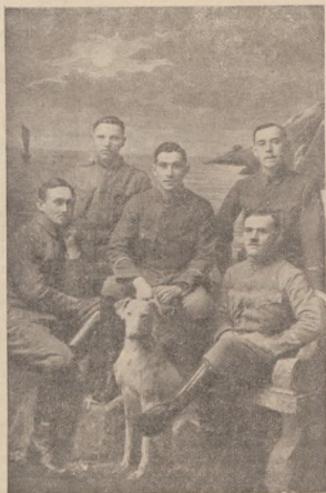
Стаційна Команда у Проскуріві. 6. VII. 1919 р.