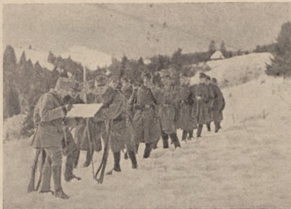
Стрілецька стежа в Карпатах.

Серед темряви забуваніли перед нами якісь постаті. Це сходили у село новий відділ Москалів. Їхній