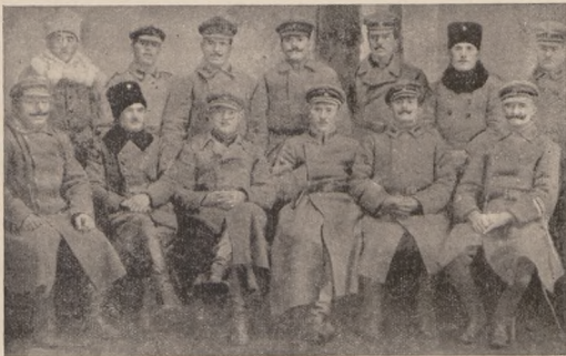
Старшини IV. курія 5. Сокальської Бригади УГА. Війтівці біля Проскурова. Червень 1919 р.

мир вол., Корець, Житомир, Київ. Гостинець добре удержаний, широкий, гладкий, а найважлише рівний наче одна лінія. По дорозі стрічали ми кременизких молодих мужчин, в солдатських одностроях, яких гуркіт наших самоходів виганяв із малих волинських хат, щоби подивитися „яка то нечиста сила шляєть-ся сюда!“ — Щасливі були, що добилися з фронту домів, а служба в українській армії видно і не в голові їм була; тому й не диво, що за них прийшли сюди Германці і Австрійці проганяти з їх загород „комуну“. Чим дальше гналися ми нашими Benz-ами