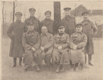
У. Г. А. Старшини на емірації в Чехах.

спільними силами відсвяткували ми шевченківське свято, відбулася одна вистава та кілька вікладів на різні теми. В тій праці ми взаімно себе пізнавали та зближувалися до себе. Однак, без огляду на буденну працю, не забували ні ми, ні селяни за тих шістьох бандитів, які ще далі укривалися. Аж одного дня прибігає до мене їх головний командант і заявляє, що тих шістьох людей вже зловили і посадили їх у волостну тюрму. Я взявся зараз до списування протоколу з ними, бо хотів докладно висвітити, наскільки вони винні в підбурюванні невідомих одиниць до розбродження наших частин, хто убив нашого підстаршину, хто їх намовив це робити й наскільки інші бандити-