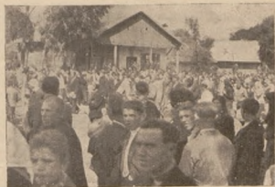
Делегації несуть вінки на стрілецькі могили в с. Вербиця коло Угнова літом 1933 р.

В тій самій праці, але на інших місці (стор. 14), подає Гуперт, що армія ген. Івашкевича в дні 15. травня, 1919. р. числила 55 батальйонів, 190 комп. скорострільів, 56 батерій, 5 ескадр і 17 швадронів; харчевий стан виносив 42.238 людей. З цього припадало на 3. дивізію лег. Зелінського — 10.714 вояків, 50 комп. скоростр., 11 батерій; на 4. дивізію піх. Александровича — 9.370 вояків, 42 комп. скоростр., 11 батерій; на групу ген. Єнджеєвського — 1.154 вояків, 11 комп. скоростр., 1 батерія.