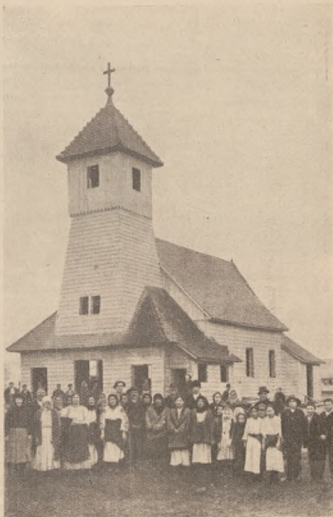
Церква в бараківій оселі в Вольфсбергу, будована в грудні 1914 і в січні 1915 рр. надієнієм Ертелем.

З весною приїздили до оселі агенти контракувати на пільні сезонні роботи до Австрії, Чех і т. д. Такі партії робітників, розуміється, тільки з вільних бараків мусли також перебувати 3-тижневу контумацію. Таких партій по 200—300 і більше душ було кілька. Кілька разів був і військовий побір. Деякі ходили на роботи в околиці Вольфсбергу. Так що бараки стали опорожняватися. Але були і нові транспорти до оселі весною 1915 р. а то з Талергофу тих талергофців, що їх звільнено, а вони не мали де приміститися. А було