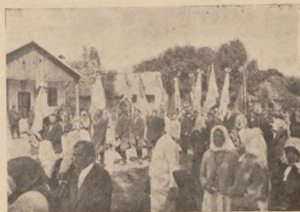
Процесія на стрілецькі могили в с. Вербиця коло Угнова літом 1933 р.

а з групи ген. Єнджеєвського (від Зубрі по Судозу Вишню);