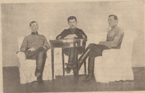
Старшини кавалерії 5 бригади. Вересень 1919.

ружно. Отакий був початок збройних виступів селян проти ріжних військових частин. А коли пощастило якомусь селові дати доброго прочуханця якійсь частині, за розбиття якої ніхто не влігнувся, то така безкарність виступу проти війська ще більше його роззухвалювала й деморалізувала. Отак саме було й з Великими Лугами. Трошки занархізовані, далися менш свідомі одиниці намовити сімома мешкаючими в селі бандитами напасти на переїжджаючі частини V. гарматного полку, розброїти й майно розграбити з метою особистої наживи. Отже цей чин села був теж наслідком хвилевого анархічного запаморочення мозків та слабкої орієнтації в ситуації, але не наслідком протигалицької стихії чи вродженого бандитизму селян. Пізніше вияснилося, що ті селяни не мають нічого спільного з вродженим нахилом до бандитизму. Ці сім бандитів свідомо представили наші частини як англічанські, які треба знищити, бо вони йдуть разом з Д-нісіном та що за ними ніхто не вставиться, бо це є відво-