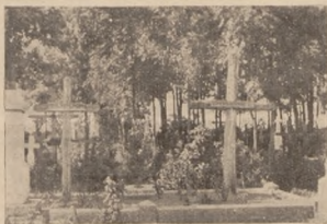
Могили полягалих на відтинку групи Угнів на цвинтарі с. Вербиці по упорядкованню 1933 р.

а.) I. дивізія стрільців, що мала оперувати тільки на Волині й стояла в Володимирі Волинським, була під командою ген. Bernard-a (шеф штабу полк. De La Laurence, а командант піхоти полк. Берещкі). Вона складалася з трох полків стрільців (1—3), кожний полк по 57 старшин і 2.500 вояків, та з бригади артилерії, що мала 36 гармат (75 мм) і 4 гармати (105 мм). Ця дивізія мала ще пів батальйону саперів, дивізіон шволежерів (346 шабель) та різні потрібні установи.