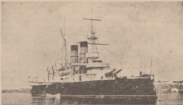
Старий лінійний корабель Чорноморської Флотії „Дванаць Апостолів“ (8.440 тон).