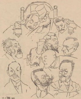
О. Курилас: Боева Управа.

Імпресійну легкість та рисункову зручність бачимо в шаржах та карикатурах О. Куриласа. Курилас малює з темпераментом, чого доказом цілий ряк малюнків, портретів та банальних мотивів, що їх виконав в часі свого побуту при УСС. В працях тих много непосредности, живости, а в портретах маркантної подібности. О. Курилас є малюарем дуже спостережливим і його як ілюстратора характеризує незвичайна прямо малюарська пам'ять. Ці своєрідні прикмети як рисівника предиспонують його в великій мірі до карикатур. Нею він спеціально не займається, при УСС виконав їх цілий ряд, за час свого побуту в коші. Там видавано тоді сатиричні літографовані жур-