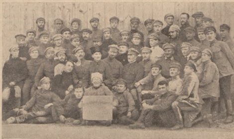
Драматичний кружок полонених старшин У. Г. А. в Тухолі 25.IX. 1925 р

Із часом спосіб життя в бараках змінився.