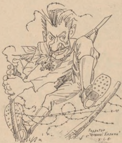
О. Курилас: підх. УСС. Угрин-Безгрішний.

ня щоби дві між УСС популярні особистості розібрати до нага та пустити з штилетами на себе.