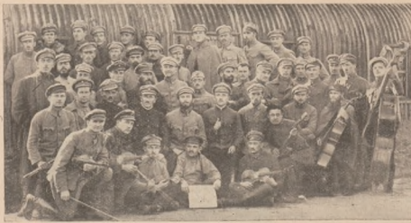
Музичний кружок полонених старшин У. Г. А. в Тухолі 25.IX. 1920 р.

В першій мірі причинився до цього вибір Старшинської Ради, що полагоджувала всі справи полонених та була для них найвищою владою. Вибрали теж старшинський суд для полагоджування спорів між старшинами. Вкінці за згодою команди табору заложили полонені свою кантину, а потім бібліотеку. Книжки діставали полонені з усіх усюдів краю, а бібліотека була дуже велика.