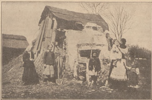
Поворот евакуованих на рідні руїни.