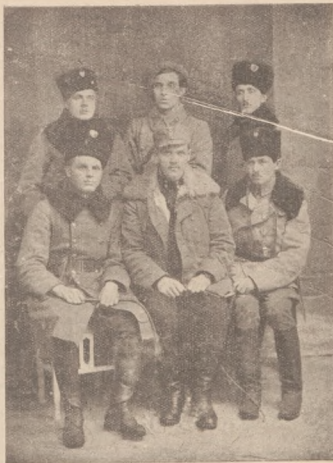
Старшини I. курія № VI. бригади по наступі на Бела, лютий 1919.

Лінія українського фронту лівого крила 18. V. рано, йшла так, як і вечером і вночі з 17. на 18. травня. На скраїно полуднево звідному крилі коло Лютовиск стояла спокійно II. Група („Група Лютовиска“) Гірської Бригади, на лінії Лаврів—Спас—Тершів (на полудне від Старого Самбора) стояла I. Група Гірської Бригади („Група Старий Самбір“). В Стрільках (на полудне від Тершова) ніби реорганізувалися частини III. Групи 8. Самбірської Бригади (передтим „Група Глибока“, або „Група Хирів“). Дальше була перерва, а український фронт розпочинався далеко на лівій ріці Бистриці, яких 25—30 км. на схід від Старого Самбора (де, докладно не знаємо, як рівнож не знаємо, які там рано 18. V. могли бути українські частини); з району на полудне від села Озимини йшов фронт на північ через Крайцберг—Дубляни до Гордині (у віддаленні яких 10—12 км на схід від Самбора). Всі ці місцевости разом з Озиминою були обсажені частинами „Групи Гофмана“ а її