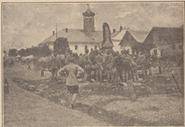
УСС. на ринку в Галичі, 28. червня 1915.

У днях між 7. та 8. вересня II. курніть У. С. С. забезпечував на 7. км. широкому фронті, між Панталіхою та Настасовом від-