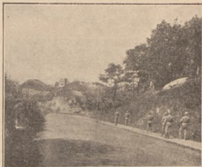
Стрільцька стежа в поході на Галич.