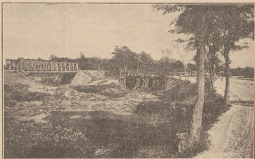
Мости на шляху до Семнковець к. Галича. За ті переходи звали УСС. Бія 30, червня 1915 р.