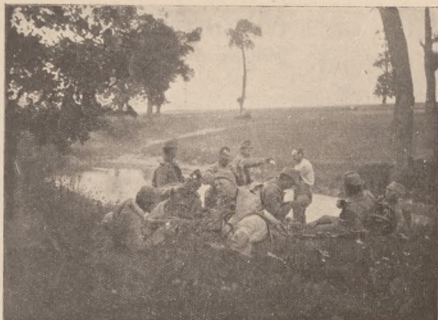
Стрілецька стежа на відпочинку.

вали ми один день чи два. Мабуть два дні, бо при нашій стрічі з їх стежею ще не видно було міста Стрия. Так чи інакше дня 19. X. 1914. р. в прекрасний соняшний осінній день лежали ми разом в цюю босяцькою сотнею у розстріляній, а перед нами бачили ми вже місто Стрий. Босяки на кожному кроці, де лягли, робили собі криття з землі (щось в роді окопів). Ті підвищення роблені ними були смішаво малі і мабуть не багато помагали навіть для криття перед оком неприятели. Ми наслідували їх як лише зуміли. Неприятеля віде не видно. Ні одного вистрілу віде не чути. Ненадб війни тут і не було, а ми робимо лише військові вправи. Нам надочутило врешті держатись сотні, яка не може рішитись на наступ, і наша стежа — маючи між собою двох жителів Стрия — відлучилася від сотні.