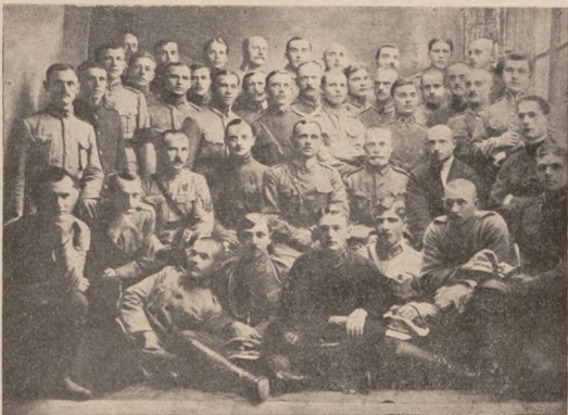
ГРУПА СТАРШИН СПІЛЬНОЇ УКРАЇНСЬКОЇ ЮНАЦЬКОЇ ШКОЛИ 1920 Р.

В жовтні 1919 р. школа урочисто зробила свій перший випуск молодих хорунжих. То були не абиякі хорунжі! Бо ж тактики, цієї основної воєнної науки — умілости вчилися не з сухих підручників, знання свої переводили не на військових „сіграх“, що при всій нибі реальності показує все ж тільки „воєнну грою“ — знання свої перевіряли в обстановці правдивого сучасного маневрового бою, мачучи перед собою не „означеного“ противника, якусь тим „сміну“, а так-таки справжно „чернову армію“ — „розігравали“ її, почавши від висилки польової стежі та від першого далекого гарматного стрілу й перейшовши через всі стадії розвитку бою,