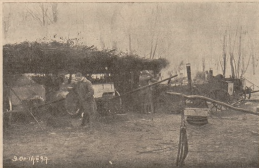
Стрілецькі кухні під фронтом у Соснові в березні 1917 р.

і вигоду військової кухні. Вона і підчас походу могла варити для відділу їду. Найскорше вирішили справу німці, які вже в 1905 р. розписали кон-