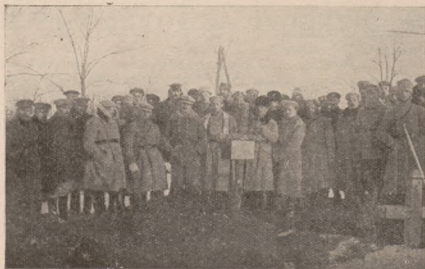
Похорон Отамана Антона Виметала, команданта 2-го колумбійської бригади — на станції „Веселий Кур“ на Вкраїні.

і прислухаюся, що він кричить, що він хоче мені сказати. В цей час хватає він обома руками за свою сорочку, вмиє оголоше свої груди і зворушеним тоном кричить: „Спасайте нас од чорносотенців!“