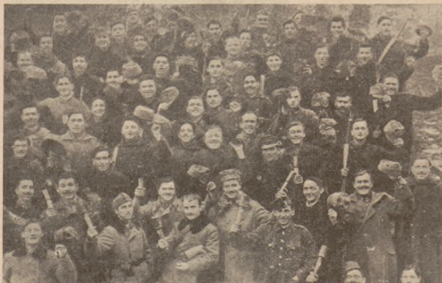
II. Запасна сотня в Дрогобичі.

Година 6-та рано, вже видно піхоту противника. Підходили до Іванич з західної сторони. Ішли колонами, їх багато. Зближались чимраз ближче. На віддалі яких 1.500 кроків. На приказ команданта заторохкотіли наші скорострілі. Заметушилися і в тій хвилині зачали розсипатися в розстрілну. За недовгий час показались піші стежі з північ. частини села Іванич. Недалека віддалі від наших окопів, тільки через леваду до 500 кроків. Нам було видно, що їх поміж будинками багато. Приказ: ціла сотня почати огнем. Заторохкотіли скорострілі і крієс, з обох сторін. Наші стрілець хоча новобранці, а не дуже були