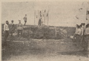
Гімнастичні вправи юнаків у Станіславові.

По місті все ще пострілюють після тієї буці, що її вчинили формування гетьманської команданта Арно й повставши в межичас большевицькі групи,