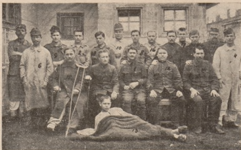
Ранені та везучі українські воїки у шпиталі в Дзедзіцах. V. 1919 р.