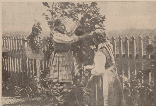
НА СТРЕЛЬЦЬКИХ МОГИЛАХ