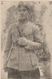
Старшинський однострій Спільної Юнацької Школи.

ючи стратегічний затишок, до якого пізніше дійде якась есентуальна військова хуртовина, тож буде більше часу для вивчення тих майбутніх юнаків й підготовки з них майбутніх старшин для тої майбутньої армії, що, вірилося, створиться.