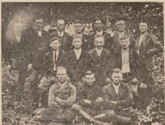
Група колишніх У. С. С. і Української Галицької Армії в Семиківцях над Стрипою.

Під вечір добрили ми рештками сил до оселі колоніста. В хаті було скромно але дуже чисто. На стіні висіли два великі портрети господарів. На їду ми довго не ждали. Хазяйка поставила перед нами кавалок сала з хлібом і самовар. Аж на другий день рано ми розговорилися з хазяїном. Щоби дістатись до фронту, треба іти тільки багнами, бо двома одинокими дорогами большевики безустанно їздять та довозять харчі та аму-