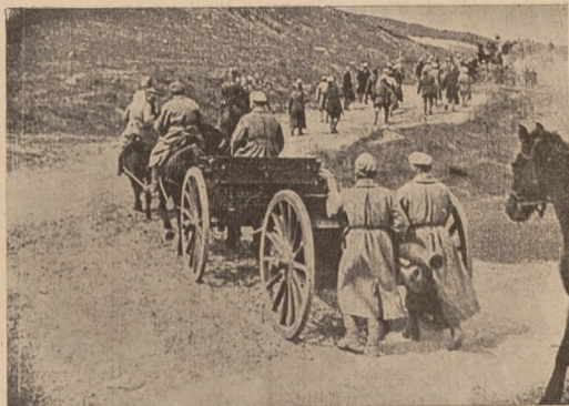
Артилерія С. С. в поході.

Світлина з Історії Січових Стрільців „Золоті Ворота”, якої друк закінчує саме Вид-во „Червона Калина”.