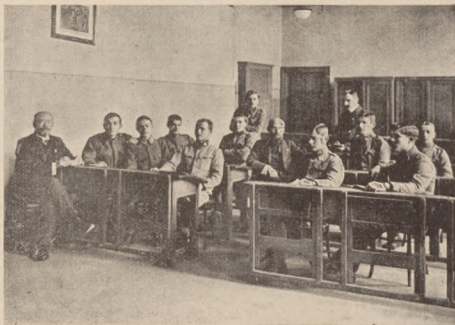
Цей сам курс. Наука в класі.

Ніхто не стежить за парадним мундуром болгарського старшини — що йде повагом до бу-