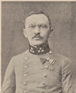
них в Угнів, повинно зацікавитися гідно ще одною передчасно виролою на цвинтарі в Угнівській могилі — могилі славної пам'яті полковника У. Г. А. Д-ра Осина Коса. Др. С. Б.

Громадянство Угнівщини, котре з пієтизмом оточує своєю опікою могили стрільців і старшин УГА похороне-