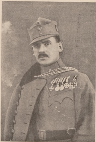
Командант 7. бригади сот. Бізанц.

Запасна сотня вислала заставу на присілок