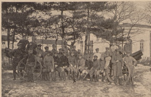
Тяжка батарея сот. Грици Сенечка в бою під Хировом. Х сот. Гриць Сенечко, І. чет. Альфред Козак.