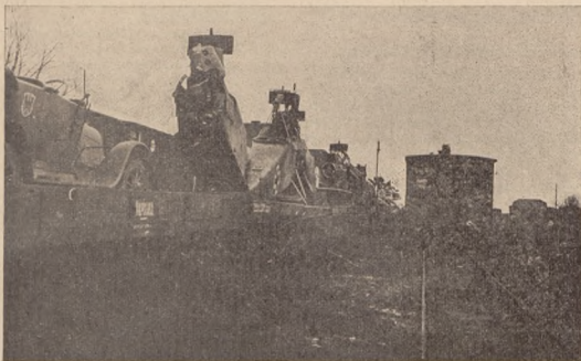
ЛЕТУНСЬКИЙ ПАРК У. Г. А. Перед відворотом на рейках у Краснім.

понад 100 штук літаків, найновіших зразків з 1917 року.