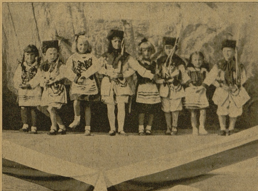
Dzieci Przedszkola tańczą Krakowiaka.