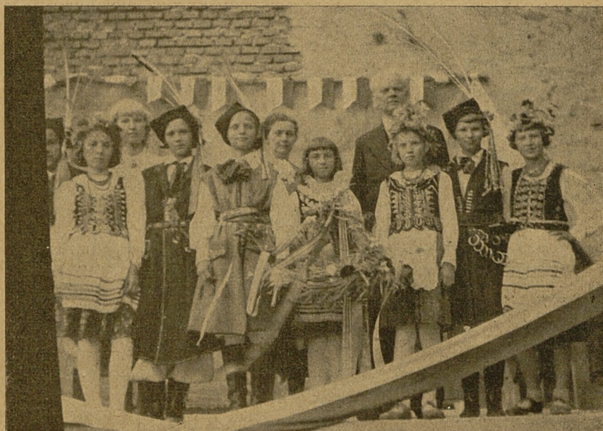
Dożynki szkolne w r. 1937.

Nakłaniamy do oszczędności. Szkolna Kasa Oszczędności lokuje składki w miejscowej Kasie Stefczyka. Jeżeli dziecko zaoszczędzi większą kwotę od złotego, otrzymuje własną książeczkę składkową z Kasy Stefczyka .