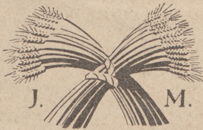
Okładka do ANHELLEGO.

skupiło uczuć i sprężyło pragnień! Ile się myśli ukryło, zrodzonych z cierpień i tęsknot jak strzały dalekonosnych!