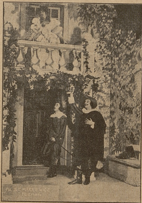
„Cyrano de Bergerac“ Rostanda w Teatrze Polskim

W mieście rodzinnem Szekspira, Stratford, spłonął przed trzema laty stary teatr, w którym odbywały się doroczne uroczyste widowiska w rocznicę narodzin Szekspira. Spalony budynek nie odpowiadał pod żadnym względem nowoczesnym wymaganiom i potrzebom sztuki teatralnej. To też podjęta została inicjatywa celem wzniesienia nowego budynku. Według zamierzeń komitetu, w nowym gmachu teatru ma być pomieszczona szkoła dramatyczna, muzeum pamiątek po Szekspirze, oraz biblioteka.