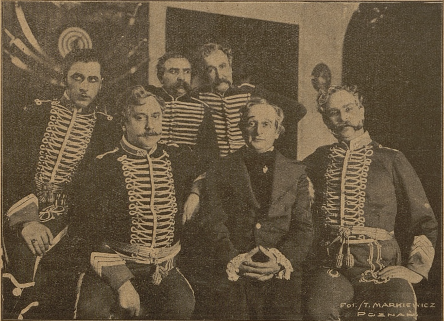
„Damy i Huzary“ Al. Fredry w Teatrze Polskim