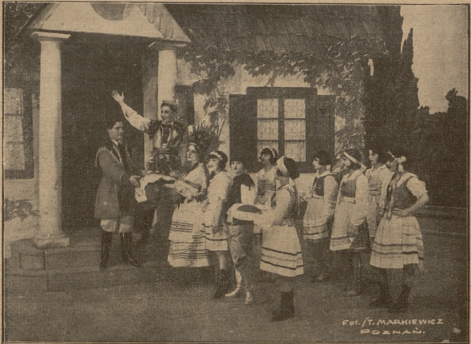
„Polska Krew“ Nedbala w Teatrze Wielkim