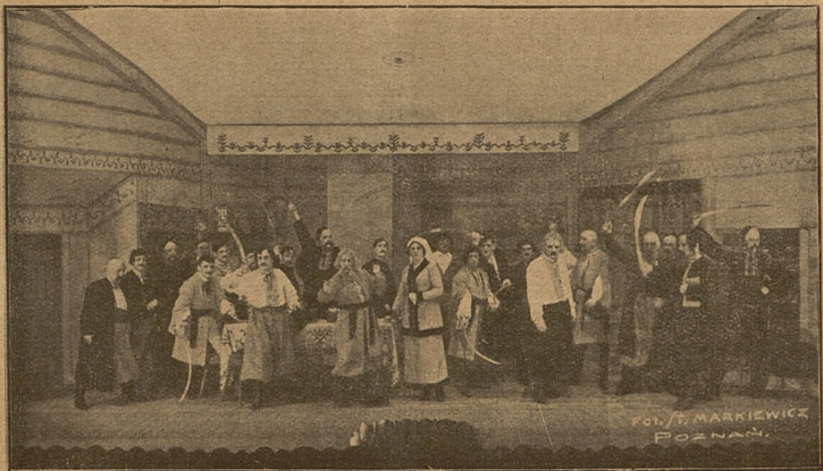
„Mazepa” Czajkowskiego w reżyserji Z. Zaleskiego