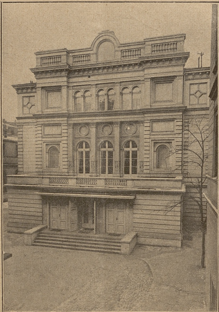
Pelen pięknych wspomnień Gmach „Teatru Polskiego” w ogrodzie Potockiego, który gościł wielokrotnie na swej scenie polskie opery w czasach przedwojennych.