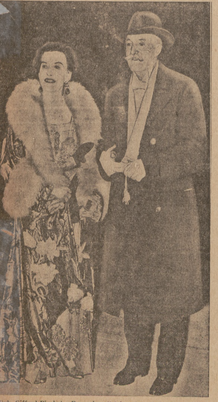
Gub. Gifford Pinchot z Pensylwanii i jego żona, która była celem ataku dawnego ze strony jednego z senatorów stanowych. Gubernator zażądał przeproszenia i dostał je od senatora.