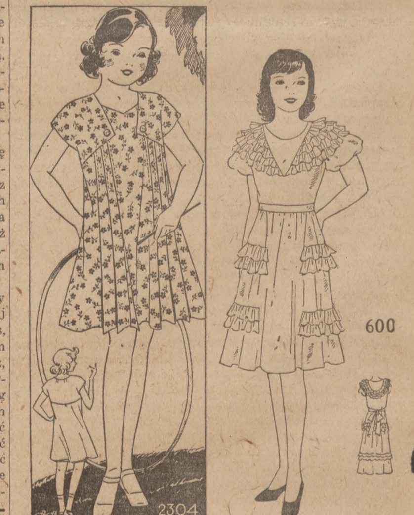
BARDOZO WYGODNA I SKROMNA. Anne Adams Modelko 2304. Zamówić można tylko w wielkościach 4, 6, 8, 10. Na wielkość 6 potrzeba 3 1/2 jarda 36 calowej materji.

Cebula dochowa się do wiosny bez wyrastania, gdy włożona w kosz będzie z wierzchu grubo plewami posypana. Stać powinna w suchem i nie mro-znym miejscu.