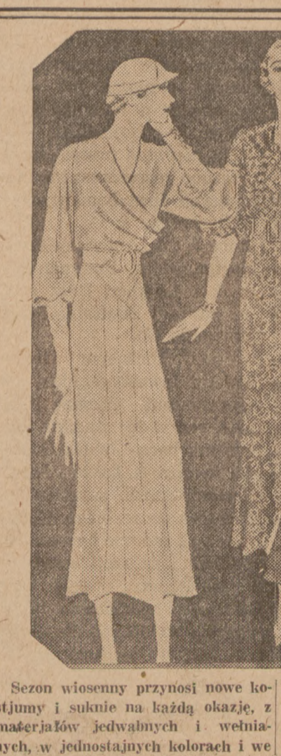
Sezon wiosenny przynosi nowe kostiumy i suknie na każdą okazję, z materiałów jedwabnych i wełnianych, w jednolitych kolorach i we wzory. Na ilustracji, od lewej ku prawej: sukienka z marszowanej krepy; krepa we wzory; suknia z cienkiej krepy jedwabnej; kostium z materiału tweed z bluzką w jednolitym kolorze; wełniana sukienka z kieszonkami.

Mały ogień powstały z rozpalania i zapalenia się nafty ugasić można najlepiej przez rzucenie nań mąki pszennej.