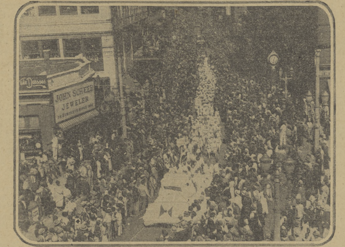
Wielka parada NRA posuwa się ulicami miasta Atlanta, w Georgia. W pochodzie, który urozmaicały stosowne rydwany, wzięło udział kilkudziesięć tysięcy ludzi. W ten sposób, Południe manifestowało swoją lojalność dla NRA.