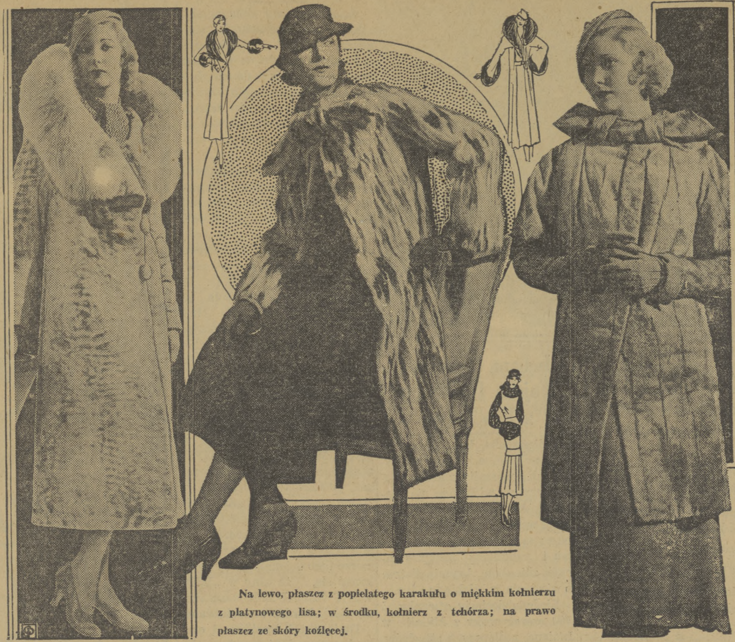
Na lewo, płaszcz z popielatego karakułu o miękkim kołnierzu z platynowego lisa; w środku, kołnierz z tchórze; na prawo płaszcz ze skóry koźlecej.

zczać się do stałego picia mleka, ser dostarcza tych ważnych składników, których dostarczyć może tylko produkt mleczny. Pół funta sera dziennie dostarczy organizmowi dorosłej osoby dosyć proteiny i co najmniej dwie trzecie tych kalorii, które potrzebne są na cały dzień życia.