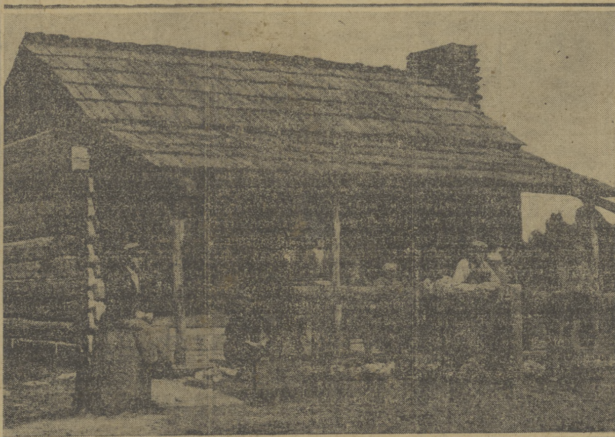
Odbudowany sklep Hilla i McNamera w Old Salem, Ill., gdzie Abraham Lincoln służył jako poczmistrz w swoich młodszych latach. Nowy Park Stanowy, obok najęcej odbudowaną wioskę, dedykowaną wczoraj uroczystość jako trwały pomnik Lincolnu.