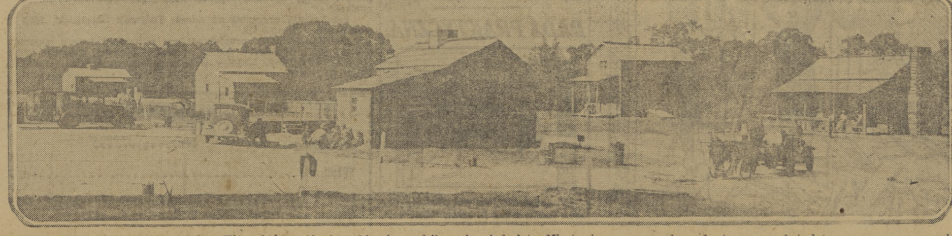
Ogólny widok miasteczka New Salem, Ill., w którym Abraham Lincoln spędził swoje młode lata. Miasteczko, przyprowadzone do stanu z przed stu lat, owawano wraz z okolicą jako New Salem State Park.