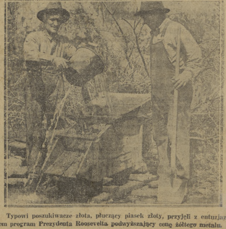
Typowi poszukiwacze złota, płucący piasek złoty, przyjęli z entuzjazmem program Prezydenta Roosevelta podwyższający cenę złotego metalu.