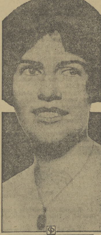
Dr. Margaret Mead spędziła dwa lata, towarzysząc New Guinea ekspedycji, w celu zebrania wiadomości etnologicznych dla muzeum Historii Naturalnej w New Yorku.

Fortytować znaczy popierać kogoś, protegować, faworyzować, zalecać... rekomendować przyjaźnie.