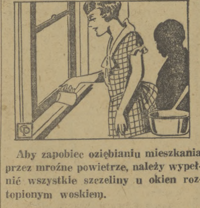
Aby zapobiec oziębieniu mieszkania przez mroźne powietrze, należy wypełnić wszystkie szczeliny u okien...