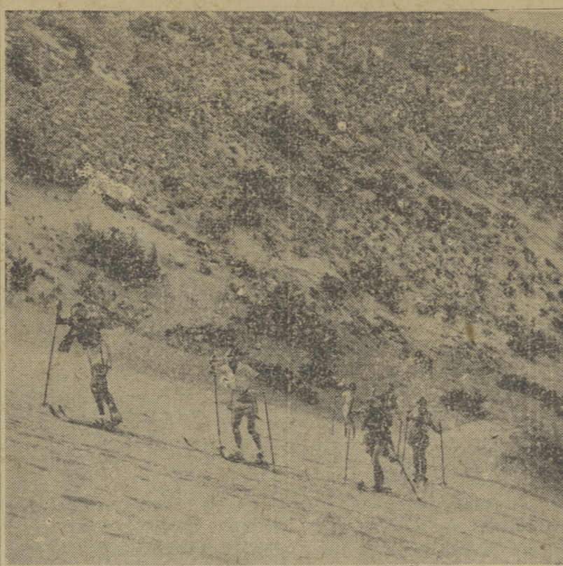
W Kalifornii, gdzie śnieg jest rzadkością, a za to mialkiego piasku jest cała obfitość, wchodzi w modę używanie nart na piasku. Na rycinie, grupa „narcarzy” na piaszczystym zboczku górskim w okolicy Palm Springs, Cal.