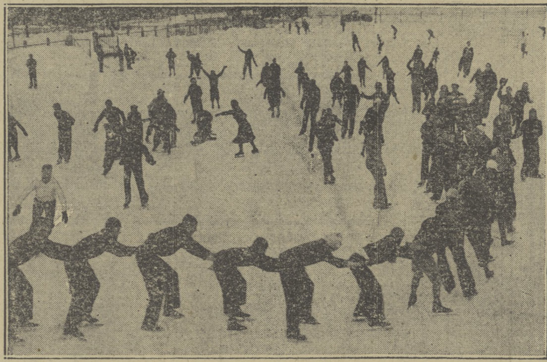
Mroźna pogoda, przysparzająca wiele cierpień biednym i opuszczonym, ma również swoje przyjemne strony. Na rybnicy, dzieci, na jednej ze ślizgawek w mieście, oddają się z zapalem zdrowemu sportowi zimowemu.