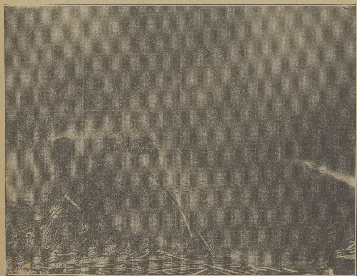
To co nie zdażyli rozebrać robotnicy zniszczył pożar, jaki nawiedził zakłady Deeringa, należące do kompanji International Harvester Company, przy Fullerton Avenue i meście na North Damen Avenue. Rychna przedstawiła strażaków ogniowych podczas gaszenia pożaru, który chwilowo groził zniszczeniem niemal całej dzielnicy. Domy sąsiednie, mieszkalne, także się paliły, ale te uratowano.