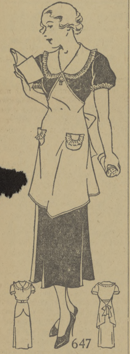
ŁADNA KOMBINACJA SUKIENKI Z FARTUSZKIEM. Modelko 647.

Nabyć można w wielkościach 16, 18 lat, 36, 38, 40, 42 cali w biuście. Na wielkość 36 potrzeba 3 1/2 jarda 39 calowej materji i 1/2 jarda 35 calowej materji kontrastowej, jakoteż 3/4 jarda rufelki.