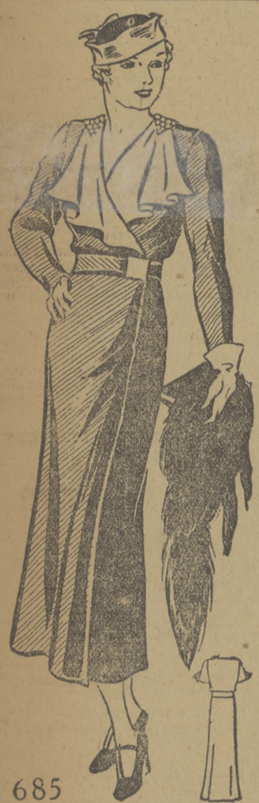
685 ZGRABNY FASON DLA KORPULENTNIEJSZYCH FIGUR. Ellen Worth Modelko 685. Zamówić można w wielkościach 36, 38, 40, 42, 44, 46 cali w biuście. Na wielkość 36 potrzeba 3 1/2 jarła 39 calowej materji i 1/2 jarła 39 calowej kontrastowej materji.