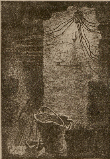
Rys. dr. Ewa Siliutńska

Hańba oszukującym co najwyższą ofiarę braci na obcym, skalnym ołtarzu złożyli chcieli. Po wieli hańba.