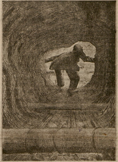
Rys. dr. Ewa Siliutńska