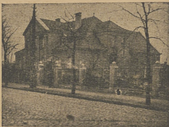
Dom Związkowy w Toruniu.