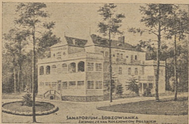
Sanatorium „Łobzowianka“ w Niemirowie - Zdroju.