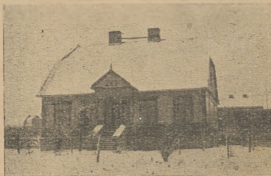
Dom Z. K. P. w Skarżysku.