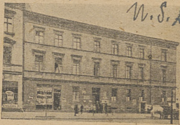
Dom Związkowy w Katowicach. (przed rozbudową)