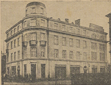
Dom Związkowy w Stanisławowie.