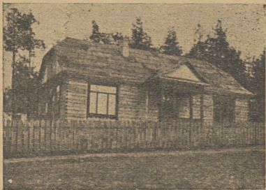
Dom Z. K. P. w Wołkowysku.