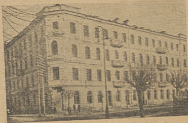
Dom Związkowy w Wilnie.