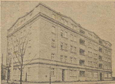
Dom Związkowy w Poznaniu.