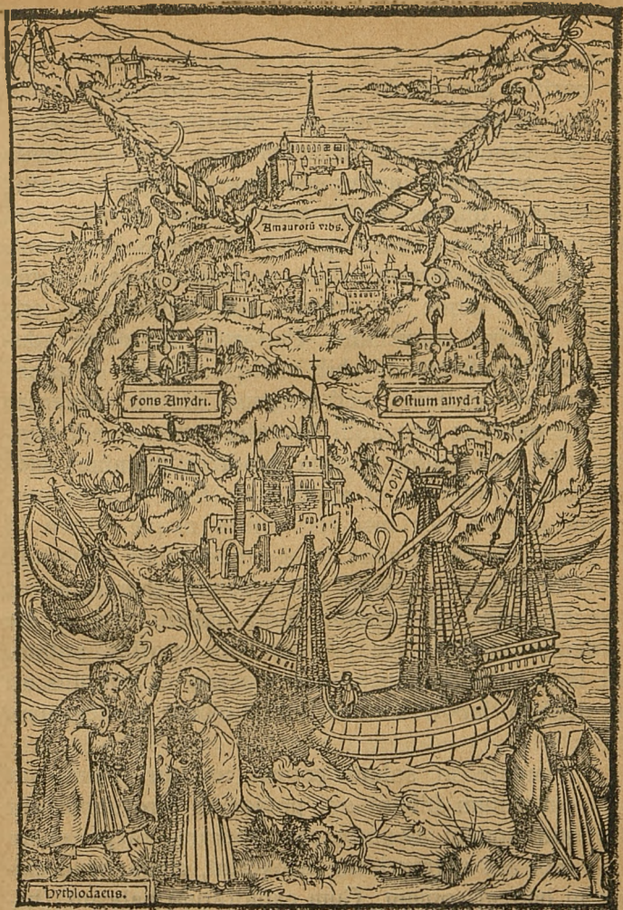
Utopia insula, ad quam Hythlodæus, expeditionis dux, pervenit.