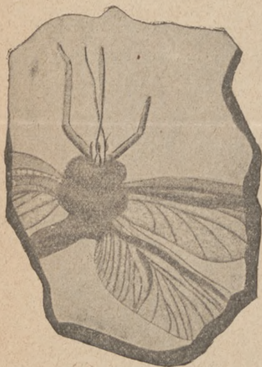
Eugereon, owad skrzydlaty perjodu węglowego.